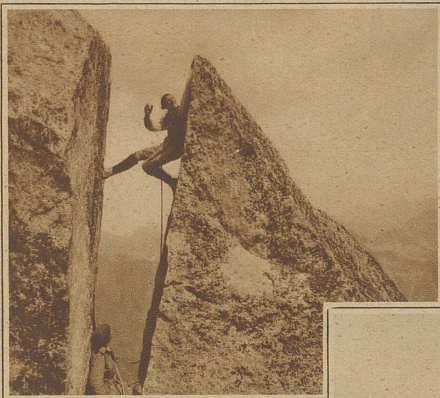
Kitzliges Uebersteigen einer Spalte des Gipfelgrates am Pizzo Galla im Bergell

schwierige Sachen nicht mit x-beliebigen Unbekannten unternommen werden sollten. Und da zeigt es sich oft, daß ein gutes Gletscherseil außer seinen technischen noch eine geheimnisvollmagische Eigenschaft besitzt. Fendrich schreibt irgend-