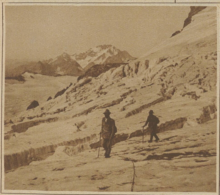
Sellapaß gegen den Monte della Disgrazia. Der Hintermann hält das Seil richtig, der Vordermann nicht

lich begreiflich. Man nimmt es darum auch zum hundertundeinten Male wieder mit, obschon es vielleicht inwendig faul ist und von außen nicht sichtbare Brüche aufweist. Und richtig, gerade bei der hundertundeinten Tour bricht es beim Passieren einer besonders kitzigen Stelle, wo es besonders in Anspruch