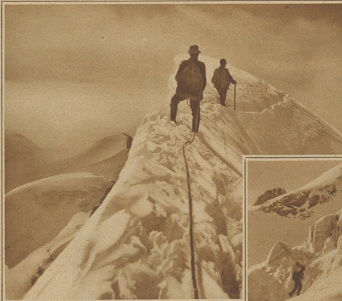
Aufstieg zum Bianco Grat am Piz Bernina. Das Seil im Vordergrund sollte straff angezogen sein, da ein Sturz sonst einen unwiderstehlichen Ruck ausüben würde

genommen wird. / In Graubünden werden die Führerseile vor Beginn der Saison durch die Führerchefs geprüft, eine begrüßenswerte Gepflogenheit, die auch von Touristenklubs durchgeführt werden sollte. / Und dann die Handhabung des Seils! Du meine Güte, da wird oft böses gesündigt. Ein Seil in ungeübten Händen wird meistens mehr Unheil anrichten als nützen. Sehr häufig sieht man, daß Geübte mit ganz Ungeübten am