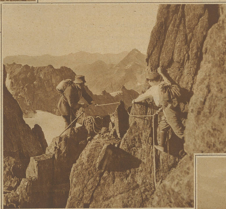
Fachgemäße Traversierung am Westgrate des Piz Vadret

Seil arbeiten, wobei dann vielfach erstere trotz aller Praxis den letzteren zum Opfer fallen müssen. Die Seiltechnik muß eben sehr gründlich gelernt und geübt sein. Dabei sei bemerkt, daß als Übungsfeld für Anfänger weder die Südwand des Matterhorn, noch die Meije, noch der Bäckmanngrat in den Dolomiten geeignet sind, sondern zunächst ein ganz bescheidenes Felsbändlein, vielleicht bei einer Klubhütte oder zu Hause in einem Tobel. Auch Kaltblütigkeit, Ruhe und Ausdauer müssen in längerer Trainingsschule erworben werden, einer Schule, die ganz besonders im Bergsport nur zu oft einfach übergangen wird. Die nebenstehenden Bilder zeigen einige Beispiele zur Seiltechnik.