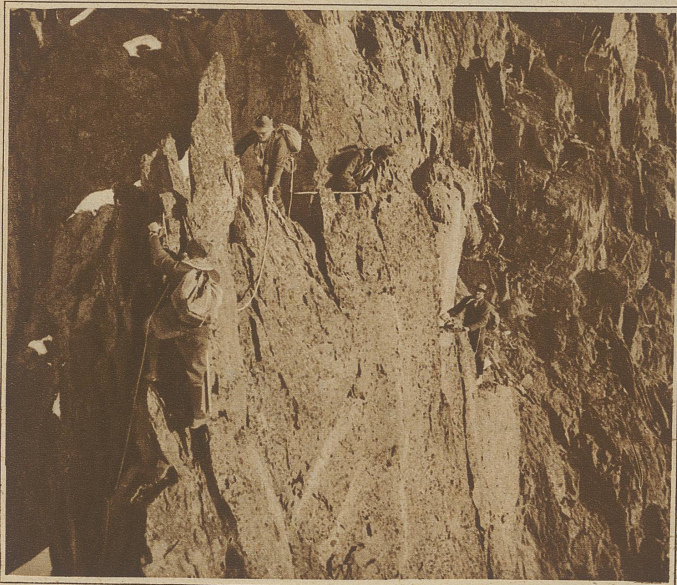
Westgrat des Piz Vadret bei Davos. Gut gesicherte Traversierung