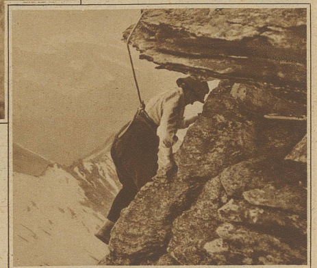
Gute Sicherung beim Abstieg vom Groß-Litner

Besonders wichtig ist die Wahl der Gefährten. Es ist wohl selbstverständlich, daß besonders