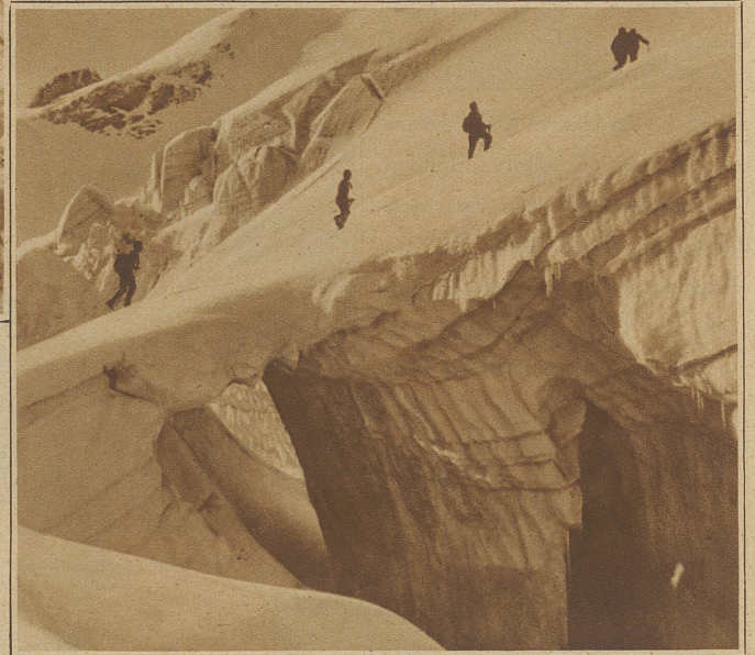
Auf dem Scalettagletscher. Hier ist das Seil kein Luxus

bringen können. Und wenn dann zu Hause der Spießler sein weises Haupt schüttelt, wenn er in rauchiger Kneipe die alpinen Unfälle liest: «Geschicht ihnen schon recht, warum gehen sie da hinauf», dann wirst du mit deinem Freunde ein mitleidig Lächeln tauschen, und vor deinen Augen werden Stunden unvergänglichen hehren Genusses erstehen voll männlichen Siegesbewußtseins nach hartem Kampfe. Es muß ein