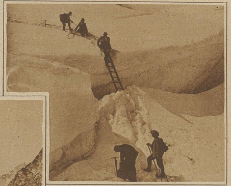
Abstieg vom Piz Bernina über die von den Führern am sog. «Bauch» angebrachte Spaltenleiter

lich begreiflich. Man nimmt es darum auch zum hundertundeinten Male wieder mit, obschon es vielleicht inwendig faul ist und von außen nicht sichtbare Brüche aufweist. Und richtig, gerade bei der hundertundeinten Tour bricht es beim Passieren einer besonders kitzigen Stelle, wo es besonders in Anspruch