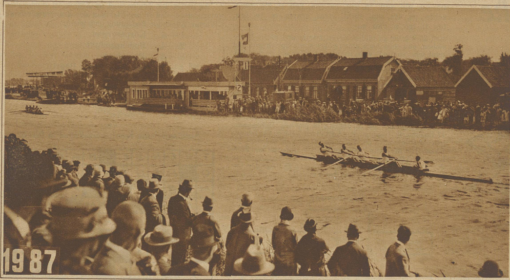
Rudern. Der Reuß-Vierer im Final um den ersten und zweiten Platz mit den siegreichen Italienern