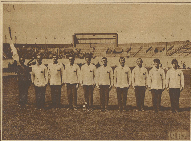
Die Turner der Tschechoslowakei, die als einzige dem Resultat der Schweizer nahekamen. Sie totalisierten 1712,25 Punkte