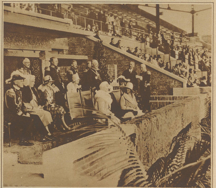
Königin Wilhelmine zu Besuch bei den Olympischen Turnwettkämpfen