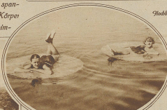
Wild links: Wasser-„Pflanzeln“ im Strandbad Stansstad

eine unaufdringliche Vertrautheit. Kein Zweifel, das Strandbad ist der schönste Erholungsort und besonders für die städtische Bevölkerung eine unschätzbare Wohltat, besonders für jene, die sich keine sommerlichen Ferien leisten können und durch ihre Arbeit an geschlossene Räume gebunden sind. Aber auch an den Kurorten erheben sie nicht nur den Reiz der Ferien, sondern spenden dem Körper und Geist erquicklichste Abwechslung.