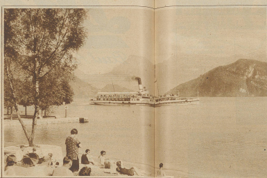
Blick vom Strandbad Viggo auf den See und die Alpen

Strand- der Stärkung vorbringt man da in sonnigster Sorglosigkeit beglückt von Sonne und Wasser und erkant plötzlich, wie wenig es eigentlich zu unserer Zufriedenheit braucht. Nicht im Übermut wahrt man hier eine erfreuliche Artigkeit und