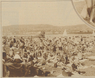
Hotbetrieb im Strandbad Zürich

von der Kinderszeit zu träumen. Welche Wonne, sich im Wasser zu wiegen, ganz umspült zu werden von dem erquickenden Nalß! Welche Lust, die Muskeln zu spannen und den ganzen Körper zu straffen, um schwimmen