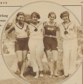
Die Schwämme des Zürcher Strandbades

Strand- der Stärkung vorbringt man da in sonnigster Sorglosigkeit beglückt von Sonne und Wasser und erkant plötzlich, wie wenig es eigentlich zu unserer Zufriedenheit braucht. Nicht im Übermut wahrt man hier eine erfreuliche Artigkeit und