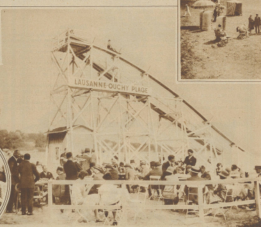
Der Vergnügen von Bainsaux-Ouchy-Plage