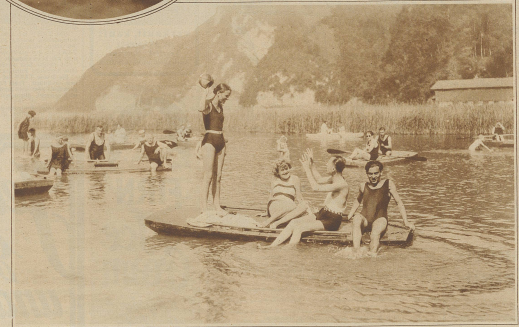
Strandbad Stansstad. Wasser und Sonne, Lust und Wärme

man ein lockendes Ziel zu erreichen. Und wie ergötzt vorerst man sich bei dem reizenden Sand- und Wasser spielen. Harmlos neckisch kommt man sich nahe und sieht in allen Menschen mitfreundliche Brüder und Schwestern, lacht und scherzt mit ihnen und freut sich seiner Unschuldheit, seines Lebens und seiner Kraft. Wannigste Stunden der Erholung und