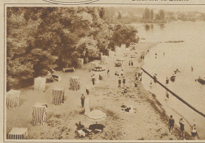
Blick auf die Plage von Bainsaux-Ouchy

Vor einigen Jahren noch der vielbestaunte Luxus einiger fashionabler Meer- und Seekurorte, sind heute die Strandbäder beinahe eine Selbstverständlichkeit an allen jenen Plätzen geworden, die für die Anlage geeignet erscheinen. Sie sind heute ein Ort, an dem sich eine gemüthliche Geselligkeit entwickelt, wo man sich an gemeinsamem Spiel ergötzt und seinen Körper der wohlthuenden Wirkung von Luft, Sonne und Wasser aussetzt. Die