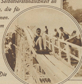
Rechts: Auf der „Wasserpflanzeln“ in Bainsaux-Ouchy

Vor einigen Jahren noch der vielbestaunte Luxus einiger fashionabler Meer- und Seekurorte, sind heute die Strandbäder beinahe eine Selbstverständlichkeit an allen jenen Plätzen geworden, die für die Anlage geeignet erscheinen. Sie sind heute ein Ort, an dem sich eine gemüthliche Geselligkeit entwickelt, wo man sich an gemeinsamem Spiel ergötzt und seinen Körper der wohlthuenden Wirkung von Luft, Sonne und Wasser aussetzt. Die