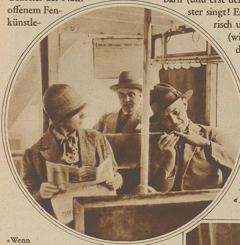
«Wenn Du denkst, Du bist allein — Mache Dir die Nägel rein!»