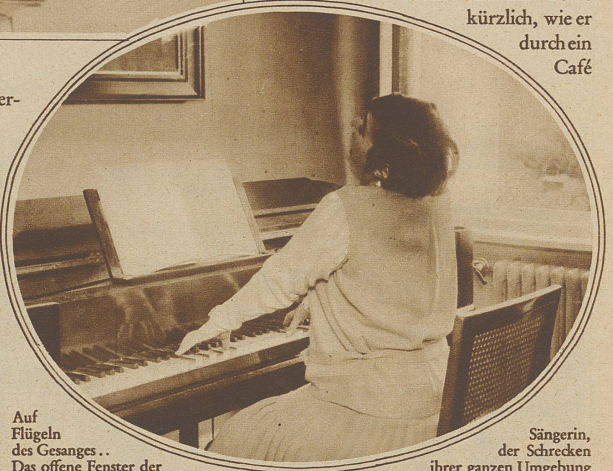
Auf Flügeln des Gesanges... Das offene Fenster der

Vetter von mir hörte kürzlich, wie er durch ein Café