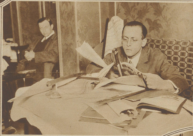
«Wer hat, hat!»

Vergnüglich setzt sich dieser an einen Fensterplatz und bald sieht er zu seiner Rechten eine schöne junge Dame. Soll er ihr den Fenster-