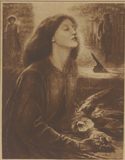
Unteres Bild: Beata Beatrix, von Rossetti

men zu bringen. Lenbach, Klinger, Keller und Stuck malen dieses weibliche Weib als Sinnlichkeit