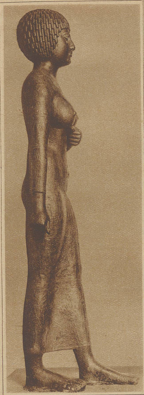
Statue der Takesut, Aegypten (2000 v. Ch.)

aus dem lebensdurstigen Italien nach dem Norden mitgebracht. Noch gleitet die Frau ohne Schwere über die Erde, noch ist sie mädchenhaft. Aber bereits seine Nachfolger kündigen durch schwellende Formen das Schönheitsideal des Cinquecento, verkör-