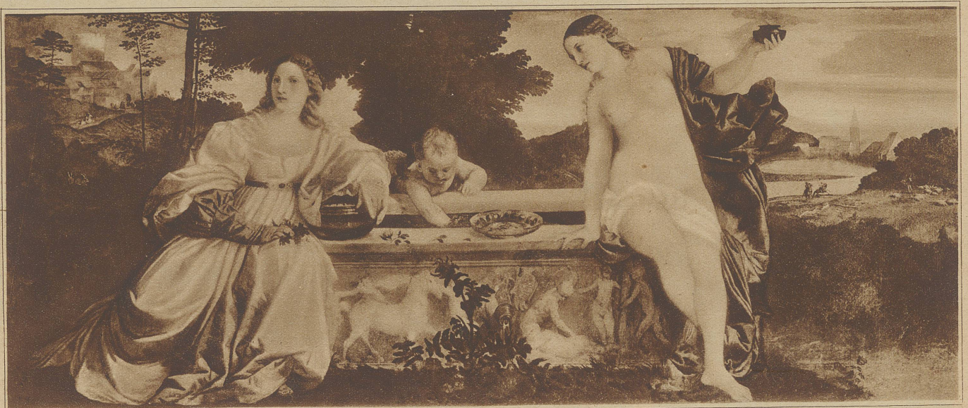
Tizian: Weltliche und geistliche Liebe

port in den Werken Tizians an. Feinnervig durchdringt Leonardo da Vinci das rätselhafte Wesen des Weibes. Er bringt zum erstenmal das eigene Schönheitsideal in die Kunst aus der eigenen Erkenntnis. Er umspannt alle Grade der Holdseligkeit bis zur Dämonie. Schönheit wird zur Pflicht, zum Strahl des Himmels. So entsteht eine Atmosphäre der Sinnlichkeit, welche die Grenzen zwischen Fürstin und Kurtisane verwischt, in der Tizian Gesetzgeber ist. Er malt das Weib als Königin rauschender Liebesfeste, ihre Schönheit in antiker Ruhe und Geschlossenheit, das Ideal der reifen Frau, die nach dem Kelter der Liebe verlangt. Noch ist Geist in diesen Formen.