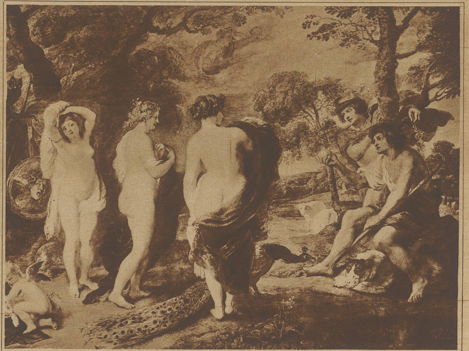
Rubens: Das Urteil des Paris

erweckende Schönheit, ohne jede männliche Tendenz. Die Kunst sich zu kleiden beginnt, deren erotische Wirkung auf der Fülle der Wandelbarkeit und Gestaltungskraft beruht. Jede Bewegung