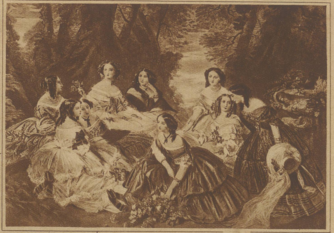
Winterhalter: Kaiserin Eugenie mit Hofdamen

lichen. Die Kleidung wird Hauptsache. Sehnsucht nach der Antike, nach dem sinnlich Leblosen wird wach, die Romantik der Gemüts-tiefe, der Unschuld, das Ideal der bürgerlichen Wirklichkeit entsteht. Die Vorherrschaft des Mannes ist angebrochen, mit ihr das Tasten der Frau, ihr Geschlecht in ausdrucksvolle For-