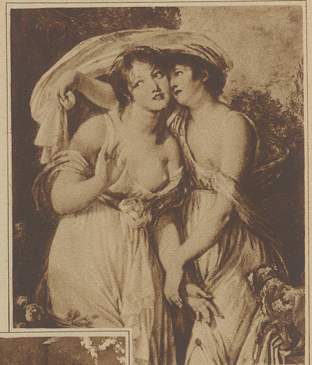
«Zwei Freundinnen» von Greuze

Rubens hat diesen ausgeschaltet. Er malt die Herrin der Sinne. Er wie Rembrandt schreiben im Banne ihrer Frauen, die jene Skala innerer Fülle des Empfindens nicht kennen und diese Ar-