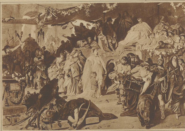
«Thusnelda im Triumphzuge des Germanicus» von C. von Piloty

port in den Werken Tizians an. Feinnervig durchdringt Leonardo da Vinci das rätselhafte Wesen des Weibes. Er bringt zum erstenmal das eigene Schönheitsideal in die Kunst aus der eigenen Erkenntnis. Er umspannt alle Grade der Holdseligkeit bis zur Dämonie. Schönheit wird zur Pflicht, zum Strahl des Himmels. So entsteht eine Atmosphäre der Sinnlichkeit, welche die Grenzen zwischen Fürstin und Kurtisane verwischt, in der Tizian Gesetzgeber ist. Er malt das Weib als Königin rauschender Liebesfeste, ihre Schönheit in antiker Ruhe und Geschlossenheit, das Ideal der reifen Frau, die nach dem Kelter der Liebe verlangt. Noch ist Geist in diesen Formen.