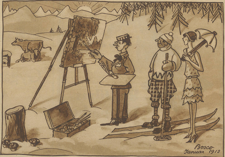
Der Landschaftsmaler. Neun mal Unsinn auf diesem Bilde

Das einst hochangesehene Handelshaus, das Gustav Freytag als Vorbild zu seinem Roman «Soll und Haben» gedient hat, ist kürzlich vollständig zusammengebrochen. Ein Beweis mehr dafür, daß es nicht gut ist, wenn Schriftsteller sich mit geschäftlichen Dingen befassen.