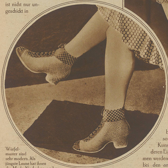
Würfelmuster sind sehr modern. Als jüngste Laune hat ihnen die Mode Niederlassung bewilligt auf dem Ueberschu. Der Schuh selbst besteht aus einem Gumminaterial, das im Effekt von Reptil-Leder gepreßt ist

Angesichts der Feinheiten und Entwicklungsmöglichkeiten, die eine neue Zeit dem weiblichen Geschlecht beschert hat, wird der einst stark umstrittene Wunsch: lieber Mann anstatt Frau zu sein, am ehesten noch im Hinblick auf Lohn und auf Beförderungsfragen in höhere Positionen laut. + Dennoch hört man selten die Frauen dem Schicksal dafür danken, Frau zu sein. Ein allzusehr auf die Stellung des Mannes im Leben gerichteter Blick hat eine große Anzahl Frauen vergessen lassen, in wieviel Dingen des praktischen Lebens die Frau dem Manne gegenüber ganz entschieden im Vorteil ist. So veranlaßt noch heute das alte Uebel der «abgerissenen Knöpfe» manchen Mann zur Heirat. Er ist nicht nur ungeschickt in