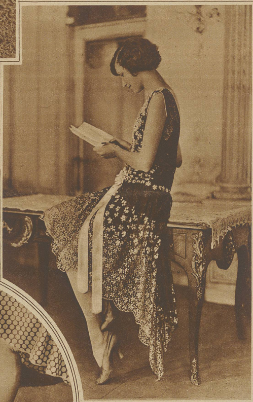
Auch die moderne Frau hat Sinn für Poesie. Sie trägt ein entzückendes Spitzenkleid, dessen «Mahlchen» auf schwarzem Grund mit rosa Rand erblühen. Das Dokument, das sie andachtsvoll studiert, dürfte eher als die Schneiderinnenrechnung . . . die eigene Verlobungsanzeige sein

besonders schmutzigen Stellen der Schaum mehrmals durch das Gewebe hindurchgedrückt wird. Dreimal in lauwarmem Wasser spülen. Das Wäschestück keinesfalls im Wasser liegen lassen, sondern dasselbe ständig durch das Wasser ziehen, damit allfällig abblutender Farbstoff sich nirgends festsetzen kann. Das Wasser ausdrücken; nicht winden! Das Stück in ein reines Tuch einrollen und es dann im Schatten ausbreiten. Bevor es ganz trocken ist, muß es in die richtige Form gezogen werden; aber man soll Kunstseide nie aufhängen, da sie sich durch das Eigengewicht verziehen könnte. Unter Benutzung eines trockenen Tuches auf der linken Seite mit einem warmen Eisen bügeln; aber nie sehr heiß bügeln. + Für farbige Seidensachen sollen Seifenlösung und Spülwasser kaum lauwarm sein und es soll sehr rasch gewaschen werden. Bei dieser Methode werden Fixiersubstanzen wie Essig, Salz, Alaun überflüssig.