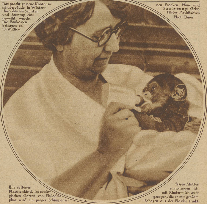
Ein seltenes Flaschenkind. Im zoologischen Garten von Philadelphia wird ein junger Schimpanse,