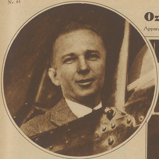
Chamberlin bei seiner Ankunft in Dübendorf

Chamberlin ist in Begleitung seiner Frau im Flugzeug in Dübendorf eingetroffen. Der von ihm gesteuerte Apparat ist ein sogenanntes Amphibienflugzeug, das sowohl auf dem Land als auf dem Wasser starten und landen kann.