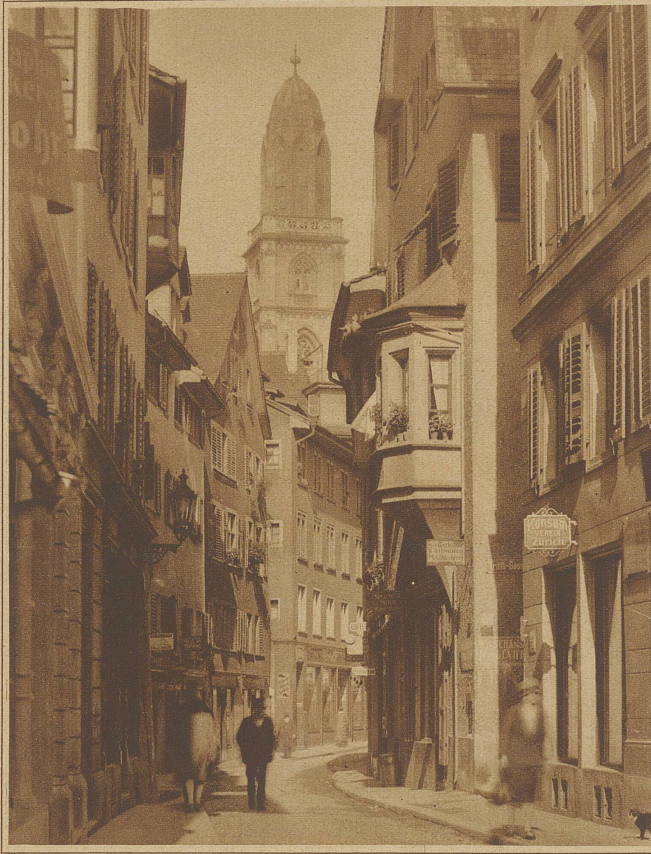
Oberdorfstraße mit Grossmünster