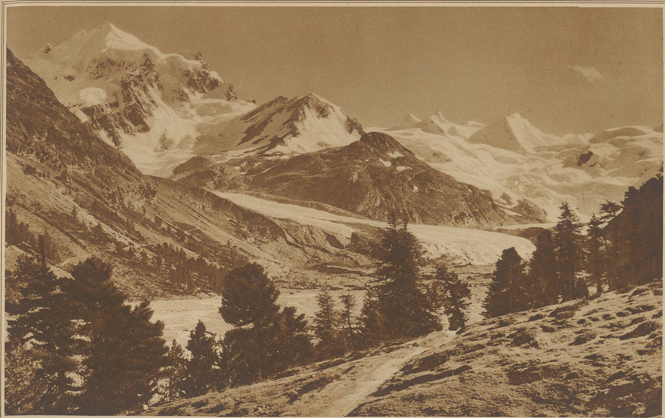
HERBSTMORGEN IM ROSEGATL