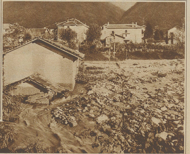
Ein von den Fluten bedrohtes Haus, das schon bis zu halber Höhe im Geschiebe steht