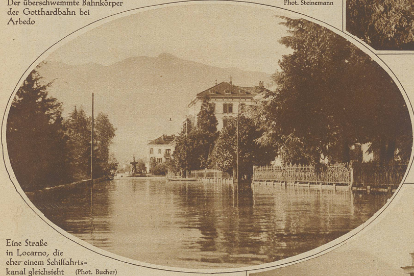
Eine Straße in Locarno, die eher einem Schiffsfahrtskanal gleicht

Untenstehendes Bild: Die Schiffspassagiere können nur über einen langen Steg trockenen Fußes ans Land gelangen