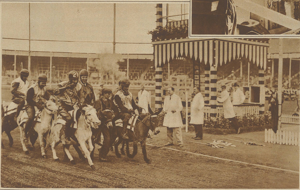
Originelles Eseltrennen in England. Wie viele der Reiter ins Ziel einliefen, wird nicht mitgeteilt