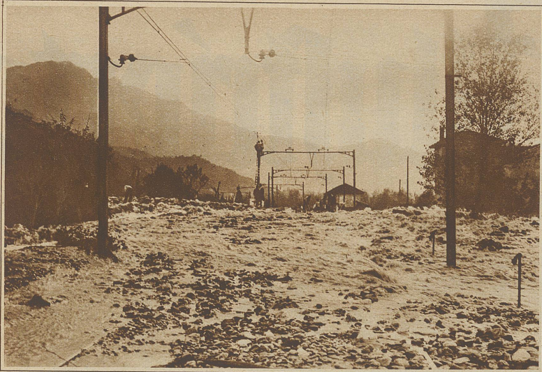
Der überschwemmte Bahnkörper der Gotthardbahn bei Arbedo

Das anhaltend schlechte Wetter am Alpensüdfuß hat im Tessin neuerdings zu starken Ueberschwemmungen geführt. Der aus dem Bergsturzgebiet am Monte Arbedo herunterkommende Wildbach hat die Geleise der Gotthardbahn bei Arbedo kurz nach der ersten Freilegung wiederum überschwemmt. Der Lago Maggiore stieg innerhalb weniger Stunden um mehr als zwei Meter und überflutete die am See gelegenen Quartiere von Locarno