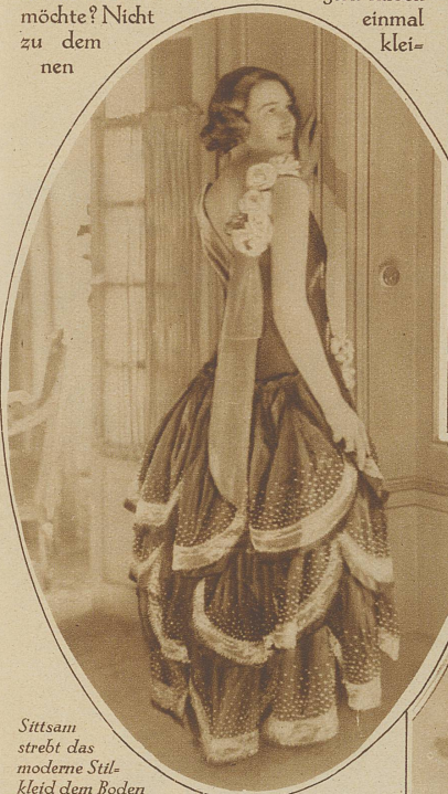
Sittsam strebt das moderne Stilleid dem Boden zu. Taffet, Blumen, Bänder, Rüschen, . . . . Frauenherz, was willst du noch mehr?

weniger an der eigenen, als an andern Frauen. Er will nicht, daß seine eigene Dame als «Dame in Rot» Bewunderer anlockt . . . . + Die kleine, ach so anständige Frau schweigt. Erstaunt, hingerissen ist sie von solcher Philosophie in Rot. + Der Freund, einmal im Zug, fährt fort: würden sich zu viele Frauen ganz in Rot kleiden, so . . . - Da unterbricht sie ihn. Und jäh schießt Röte ihr ins Gesicht, daß sie noch entzückender aussieht, als vorher, da sie blaß vor Zorn. «Liebster Freund, bitte . . . . eine Frage. Aber bitte antworten Sie ernsthaft! . . . . Glauben Sie . . . daß mir . . . rot gut steht?»