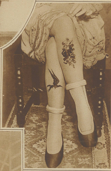
Handmalerei auf dem Bein wirkt sich als Dekors des feinen Seidenstrumpfes aus. Immer noch besser, als wenn Damen das nackte Bein zur Mode erheben.