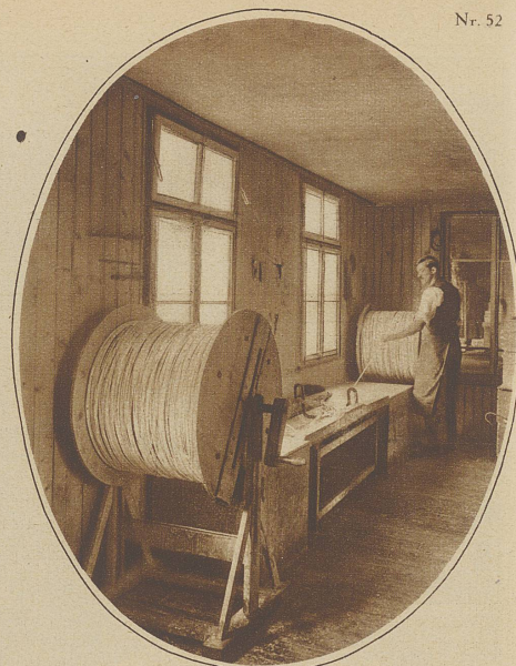
Das Ziehen von Wachs zu Wachsstöcken und Weihnachtskerzen

Der Mittelpunkt unseres Weihnachtsfestes ist doch der Weihnachtsbaum, die schmuckbeladene Tanne, auf der die bunten Kerzen flackern. Ewig schön sind die goldenen Lichter der Christnacht, so poetisch die Stimmung, die das kleinste Weihnachtsbäumchen in die ärmste Hütte mit sich