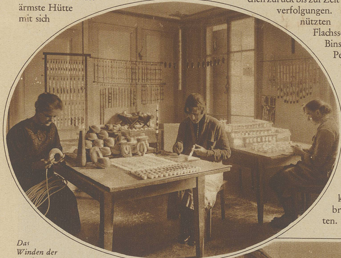
Das Winden der Wachsstöcke und Verzieren der Kerzen

Die Kirchenkerzen werden ihres Formats wegen noch von Hand gegossen und müssen aus reinem Wachs hergestellt werden