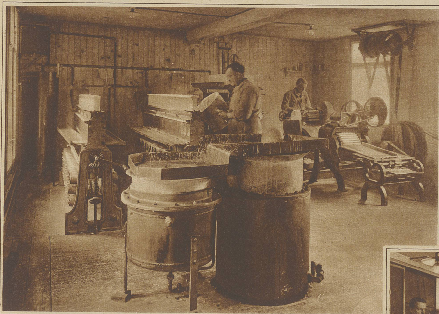
Fabrikation der Haushaltskerzen