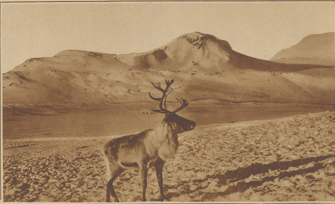
In den Eisfeldern Alaskas. Der Herr der endlosen Schneeflächen