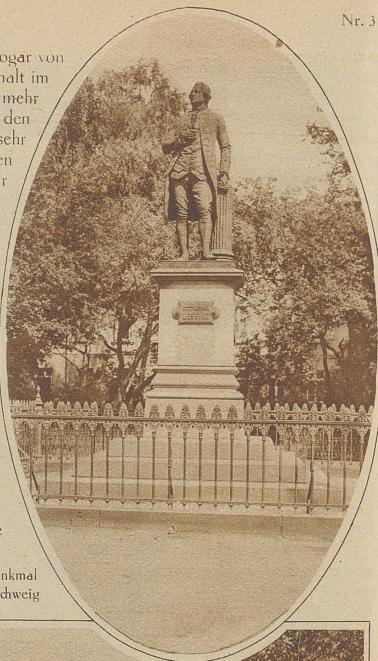
Lessing-Denkmal in Braunschweig

fünf Jahren. Obwohl er in Wien geradezu herzlich aufgenommen und sogar von der Kaiserin Maria Theresia empfangen wurde, machte ihm der Aufenthalt im Grunde genommen wenig Freude. Der Vermählung schien nun nichts mehr im Wege zu stehen, als plötzlich die Aufforderung an Lessing kam, den Prinzen Leopold von Braunschweig auf eine Italienreise zu begleiten. So sehr erwünscht ihm in einer früheren Zeit ein solch ehrenvoller Auftrag gewesen wäre, so sehr empfand er ihn jetzt als einen Zwang, dem er sich nur ungern fügte. Erst im Oktober des Jahres 1776 fand endlich die Hochzeit statt. Zu Beginn des folgenden Jahres führte ihn eine Reise nach Mannheim, wo er glaubte die Stelle des Dramaturgen am Theater zu erhalten. Es war aber wieder eine der vielen vergeblichen Hoffnungen. Ein schwerer Schlag traf ihn am 10. Januar 1778. An der Geburt des ersten Sohnes starb seine Frau und dem Kinde war auch nur ein Leben von wenigen Stunden beschieden. Ein kurzes, aber um so tiefer wurzelndes herzliches Glück an der Seite einer Frau, die ihm liebend und sorgend zur Seite stand, die selbst geistreich und arbeitsam war, nahm ein jähes Ende und ließ ihn seine Einsamkeit noch tiefer fühlen. Dazu kam noch, daß er gerade in dieser Zeit in scharfe Polemiken verwickelt war. Solche gehören zwar in sein Leben und er hat damit auch viel erreicht. Mit unerbitterlicher Strenge hatte er den Kampf gegen den Zeitgeist aufgenommen, der mehr auf den Schein sowie auf die Wichtigkeit des