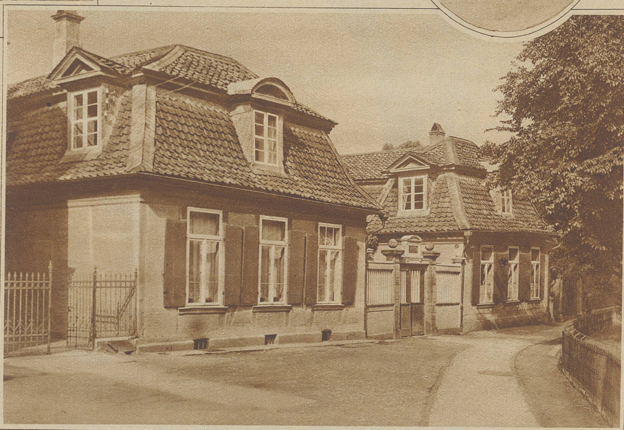
Das Lessing-Haus in Wolfenbüttel