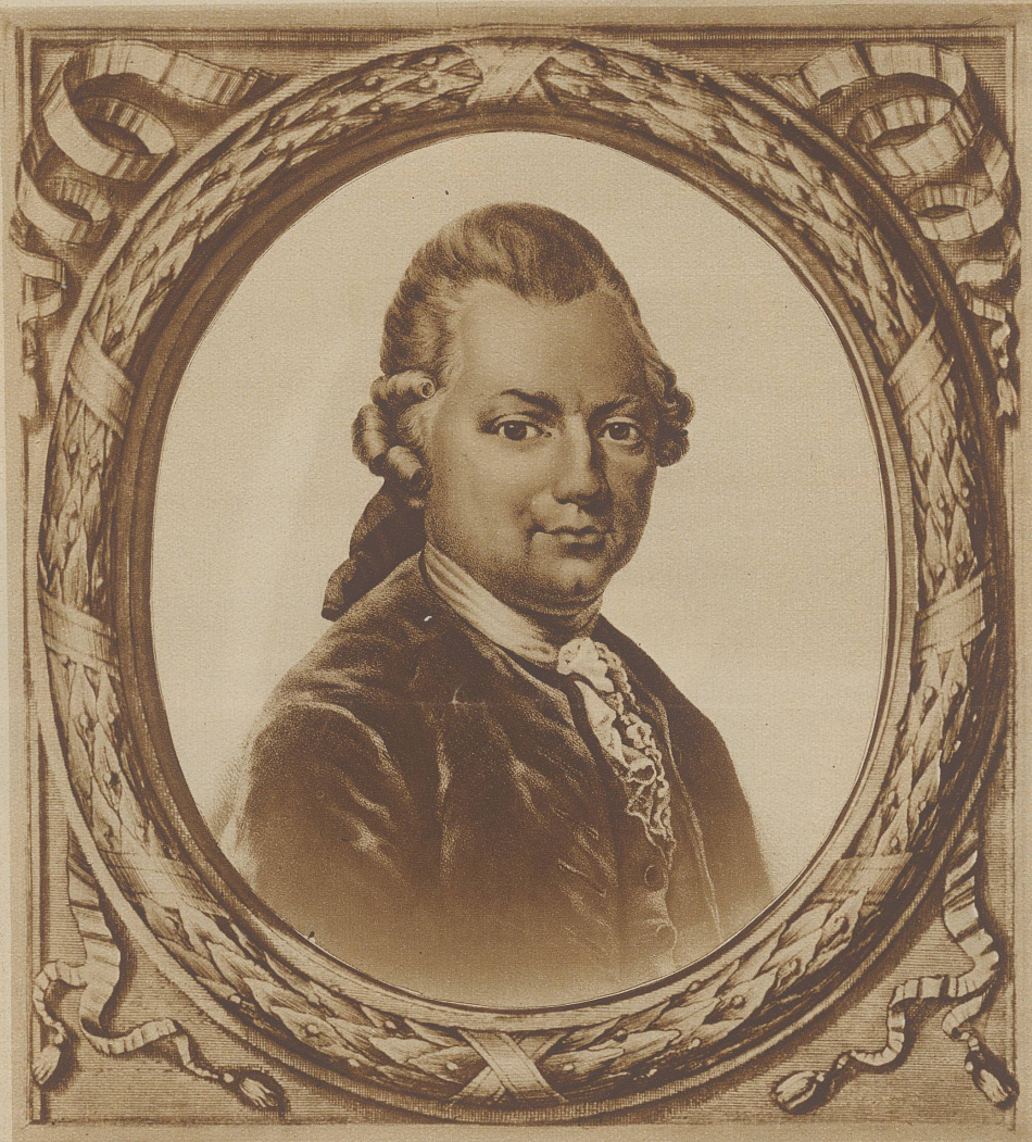
G. E. LESSING

Von Breslau im Jahre 1765 nach Berlin zurückgekehrt, erwarb sich Lessing um eine Stellung als Bibliothekar, doch erfolglos, da Friedrich der Große Widerstand leistete. Von dieser Zeit an war ihm Berlin eine «verzweifelte Galeere» und gerne folgte er zwei Jahre später einem Ruf nach Hamburg, wo er als Dramaturg an dem neugegründeten National-