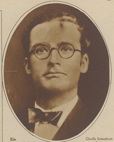
Ein weißer Rabe. Große Sensation verursacht gegenwärtig in England folgende Nachricht: Viscount Ennismore, Sohn und Erbe des Grafen Listowel, ist ein überzeugter Sozialist; er kündigt öffentlich an, daß er seine Theorien nun verwirklichen, seinem Titel als Lord entsagen und sein Vermögen unter die Armen verteilen werde. William Francis Hare — so wird er von nun an heißen — wird sich selbst wöchentlich ganze 3 Pfund Sterling zum Lebensunterhalt gewähren. Er hat eine anonyme Gesellschaft gegründet, um es den reichen Gesinnungsgenossen zu ermöglichen, sich ihrer Güter ebenfalls zu entledigen und selbe unter die Armen zu verteilen