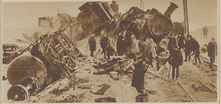
Bild rechts: Bei Lysa a. Elbe (Tschechoslowakei) fuhr ein Personenzug in einen Postzug hinein, wobei ebenfalls 4 Personen getötet und 15 schwer verletzt wurden