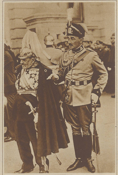
Der älteste Marschall ist wohl der Spanier Don Fernando Weyler, der anlässlich seines Geburtstages vom König empfangen wurde