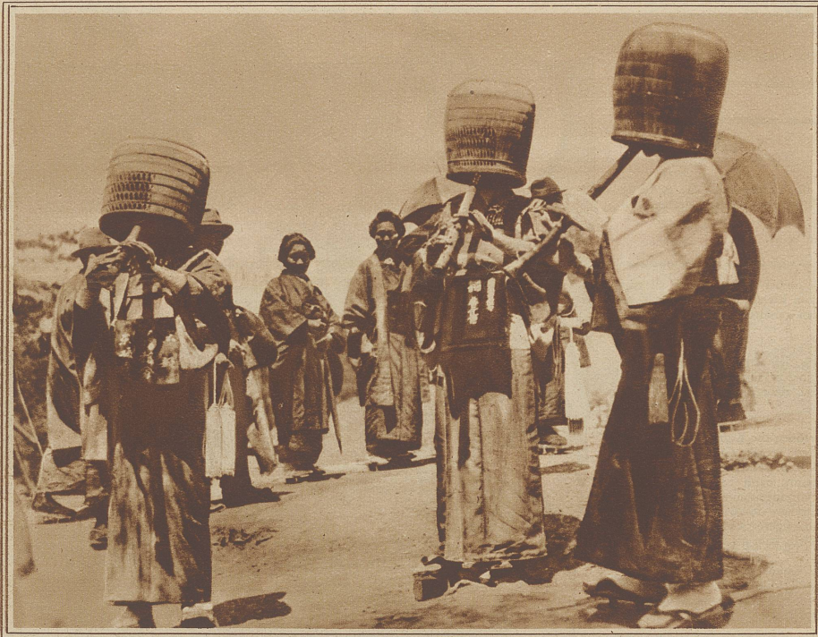
Vor den Tempeln von Nara bedecken sich die japanischen Buddhisten die Gesichter mit Körben und blasen zur Sühne der Gottheit alte Weisen auf der Flöte

Sie ist erschrocken. Sie wagt schwache Einwendungen.