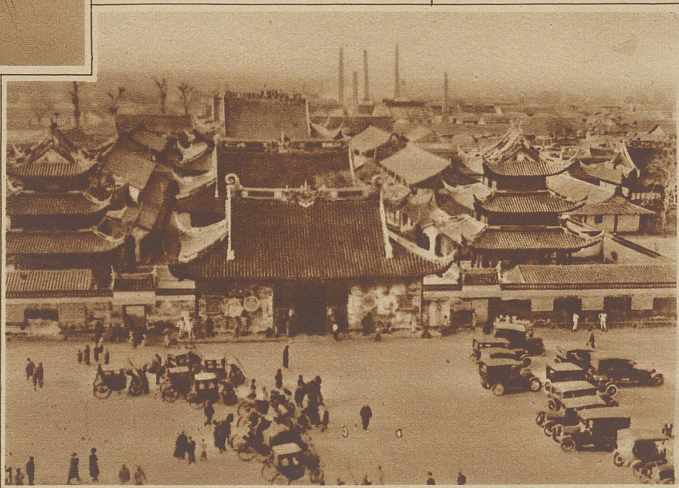
Die Konfuzepagode am sogenannten Pfirsichblüten-Sonntag, an dem jeder chinesische Autobesitzer der Sitte gemäß einen Ausflug zu ihr macht. Im Hintergrunde die Schornsteine der neuen Fabriken

Als Präsident Wilson das Schlagwort vom «Selbstbestimmungsrecht der Völker» in die Welt schleuderte, hat er wohl schwerlich geahnt, daß es sich in so kurzer Zeit gegen die Weißen kehren und deren Errungenschaften im Osten bedrohen würde. Bis zur Proklamierung dieses Gedankens haben die Chinesen, abgesehen von den rasch niedergeschlagenen Aufständen gegen die Fremden, es jahrzehntelang selbstverständlich gefunden, daß sämtliche Häfen ihres riesigen Landes in den Händen der Europäer waren und damit auch alle Rechte und Einkünfte des Handels und der Politik. Reiche, große Städte mit fast ganz europäischem Charakter blühten in ihrem Lande auf, ohne daß sie den geringsten Einfluß auf sie, den