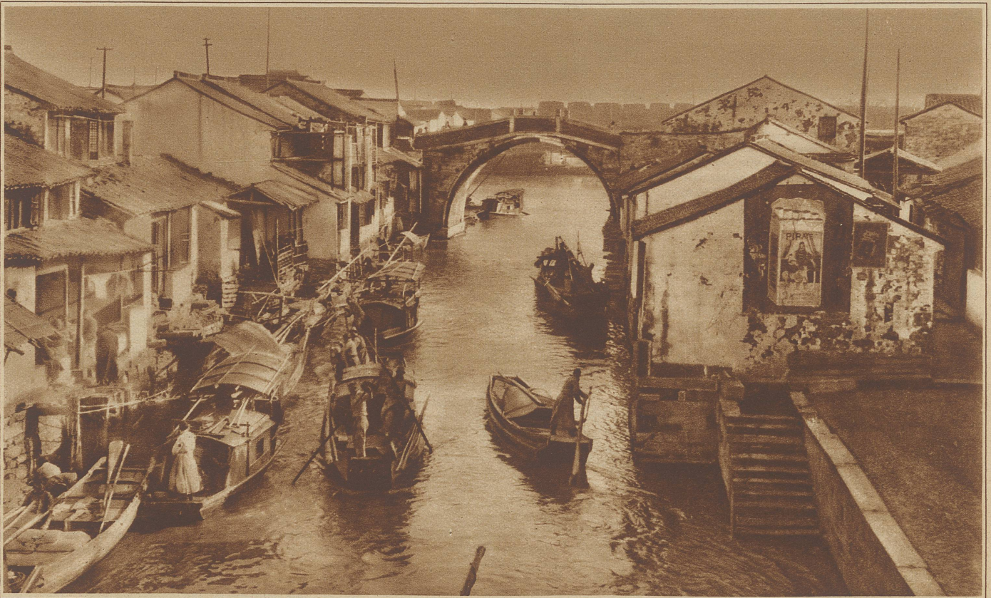
Das nahe von Schanghai gelegene Soochow, wegen der Kanäle das «chinesische Venedig» genannt, mit Hausbooten

Mittelpunkt der chinesisch-englischen Auseinandersetzungen bildet. / Es wäre ein unersetzlicher Verlust für den ganzen Osten, wenn Schanghai zerstört würde. Diese moderne Stadt ist von bedeutender Schönheit und Wohlgepflegtheit und seine Hauptstraßen mit dem riesigen Verkehr, den sechsstöckigen, abends glänzend erleuchteten Warenhäusern sind durchaus weltstädtisch. Die Europäer werden in diesem Viertel nur durch die grellen Plakattafeln mit den chinesischen Buchstaben und die zahllosen Rikschas daran gemahnt, daß sie in Asien sind. Eine tadellos gebaute Schnellbahn überquert den Soochow-Fluß auf einer Hochbrücke, die große