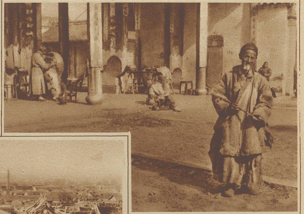
Bettler im Vorhof des Tempels. Im Hintergrund: Der Barbier rasiert den Priester

Als Präsident Wilson das Schlagwort vom «Selbstbestimmungsrecht der Völker» in die Welt schleuderte, hat er wohl schwerlich geahnt, daß es sich in so kurzer Zeit gegen die Weißen kehren und deren Errungenschaften im Osten bedrohen würde. Bis zur Proklamierung dieses Gedankens haben die Chinesen, abgesehen von den rasch niedergeschlagenen Aufständen gegen die Fremden, es jahrzehntelang selbstverständlich gefunden, daß sämtliche Häfen ihres riesigen Landes in den Händen der Europäer waren und damit auch alle Rechte und Einkünfte des Handels und der Politik. Reiche, große Städte mit fast ganz europäischem Charakter blühten in ihrem Lande auf, ohne daß sie den geringsten Einfluß auf sie, den