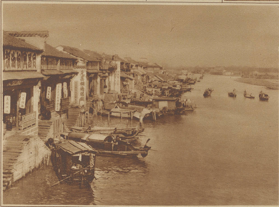
Bild links: Ufer des Soochow-Flusses mit chinesischen Häusern und Hausbooten

ihren Besitzern, so daß manche chinesische Straßen wie eine riesige Vogelhandlung aussehen. Am sonderbarsten für unser Gefühl sind die chinesischen Leichenbegängnisse, denn das chinesische Sittengebot schreibt den Hinterbliebenen vor, alles, was der Verstorbene besaß, welchen Wert es immer hatte, ihm entweder ins Grab mitzugeben oder am Bestattungstage während der Leichenfeier zu verbrennen. Bei den Reichen geschieht dies auch wirklich noch heutigen Tages und so köstlich die Juwelen und Schmuckgegenstände sind, die man in die Gräber legt, sie werden selten gestohlen. Graberschändung ist das entsetzlichste aller Verbrechen. Weniger Bemittelte schlagen, um dies zu sparen, einen Ausweg ein. Zwar wollen auch sie den teuren Entschlafenen nicht um sein Recht bringen, das zu Lebzeiten Benutzte und Besessene durch die Verbrennung in den allewigen Besitz in das Jenseits mitzunehmen. Aber da nach dem Einäschern der