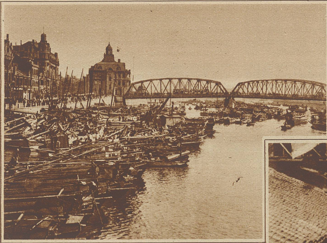
Handelskai an der Mündung des Flusses mit der großen Eisenbahnbrücke

Wertsachen ja doch nichts übrig bleibt, meinen sie, daß eine Verfeuerung von Kopien der Gegenstände dieselben Dienste tue. Man läßt also aus Werg, Papiermaché, Goldfitter und künstlichem Moos Nachbildungen aller Art anfertigen, die übrigens oft sehr teuer sind und manchmal Tausende von Dollars kosten. Sie versinnbildlichen in grotesker, oft monströser Weise die Besitztümer des Toten. Grell herausgestaffelte Papiergötzen und buntemalte und greulich bekleckste, possierlich-phantastische andere Papiergebilde gibt es da. Ihre Dimensionen hängen ohne jede Naturalistik einfach von der Noblesse des Spenders ab. Oft ist ein Pferd größer als ein Haus, aber das stört niemanden. Diese Papierkuriosa werden im Leichenzuge mitgetragen und auf offener Straße verbrannt. Obgleich das Nebeneinander von zwei Welten in Schanghai ziemlich grotesk wirkt, hat doch der,