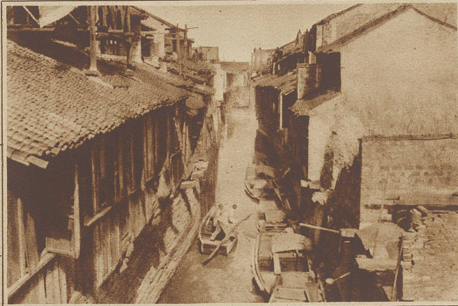
Ein Kanal in Soochow

Gegner zu schlagen, und sei es auch im eigenen Lande. Diese Willkür der einzelnen Führer hat China jahrzehntelang zum Schauplatz von Räbereien und Plündereien gemacht, Eisenbahnlinien mußten durch