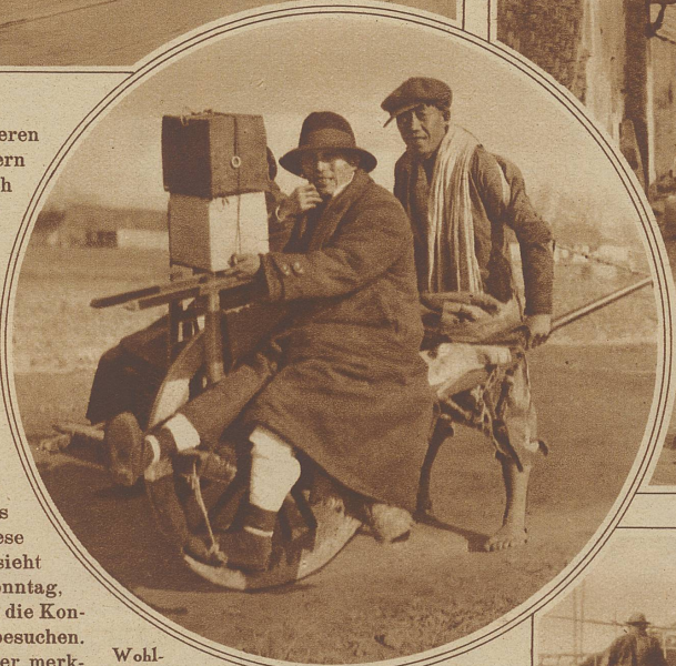
Wohlhabende fahren abends auf dem Wheelbarrow genannten einrädigen Karren ihre Vögel in den Vogelkäfigen spazieren

Dampfer unter sich passieren lassen kann. Aber an den Ufern dieses Flusses findet man noch viele echte chinesische Häuser mit den ebenso romantischen wie schmutzigen Hausbooten, in die die Einwohnerchaft Schanghai über Weekend Ausflüge den Fluß hinauf unternimmt — die einzigen allerdings, die man von Schanghai unternemen kann. Die ausgezeichnete Asphaltierung der Straßen kommt den zahlreichen Autos zugute. Jeder reiche Chinese hat sein eigenes Auto; man sieht das am besten am Pfirsich-Sonntag, an dem es die Sitte gebietet, die Konfuze-Pagode im Auto zu besuchen. Dort wird dem Europäer der merkwürdige Zusammenklang europäischer Kultur mit uralten chinesischen Städten am grellsten vor das Auge treten. Der Tempel mit seinen drei Dächern und Nebenheiligtümern, dahinter die rauchenden Schloten der Fabriken, davor die Autos der eleganten Welt von Schanghai zwischen den menschenunwürdigsten Fahrzeugen, den von Männern gezogenen Rikschas — wahrlich, ein erstaunliches