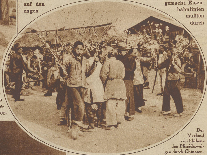
Der Verkauf von blühenden Pfirsichzweigen durch Chinesenjugen bei der Konfuzepagode am Pfirsichblüten-Sonntag

oder weniger unberührt, der maleische Schmutz auf den engen