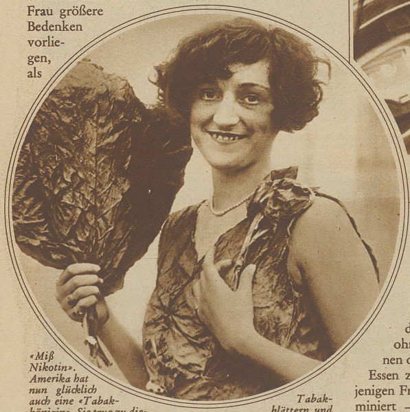
«Miß Nikotin». Amerika hat nun glücklich auch eine «Tabak-königin». Sie trug zu diesem feierlichen Akt ein Kleid aus

Das Rauchen der Frau ist so alt wie das der Männer, also durchaus keine Erscheinung der Neuzeit. Bei nicht wenigen Naturvölkern rauchen seit alters bis in unsere Zeit Männer und Frauen gleichviel oder sie kauen beide emsig ihren Tabak. / Wenn gegen das Rauchen der moder- nen Frau größere Bedenken vorlie- gen, als