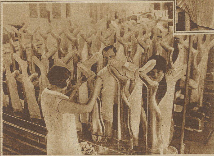
Blicke in die «Formerei» einer Strumpffabrik. Die Strümpfe werden teils über flache, teils über plastische Beinformen gezogen

In Berlin wurde letzthin eine alleinstehende Frau durch das jämmerliche Miauen ihres Büsi aus dem Schlaf geweckt, bemerkte einen starken Gasgeruch und vermochte gerade bis zum Fenster zu kommen, es aufzureißen und brach dann ohnmächtig zusammen. Ohne ihren vierbeinigen Kameraden wäre die Frau das Opfer einer schadhafte Gasleitung geworden