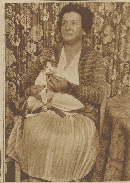
«Das Büsi als Lebensretter»

können diese Symptome also auch ohne das Rauchen bestehen, dem sie zugeschrieben werden. / Ueberaus