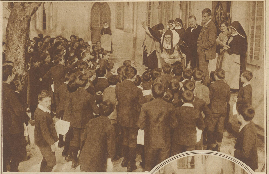
Der Hofnarr verteilt in Rathausen unter die Schuljugend allerlei Süßigkeiten