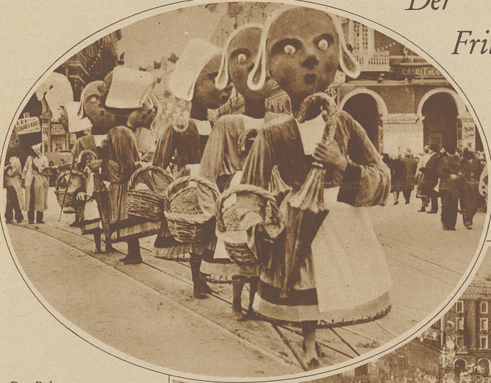
Die Bekassinen (Wasserschneepfen) im Umzug