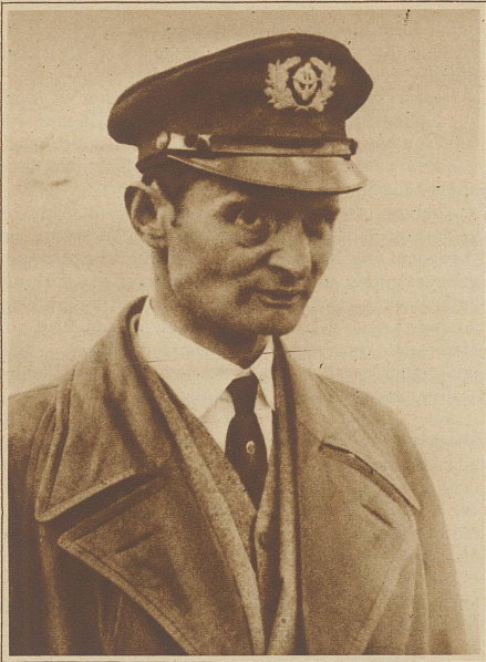
Freiherr von Hünefeld, der zusammen mit Hauptmann Köhl und Oberst Fitzmaurice die erste und bis heute einzige Ozeanüberquerung im Flugzeug in ost-westlicher Richtung ausführte, ist an den Folgen einer Magen- und Darmoperation gestorben