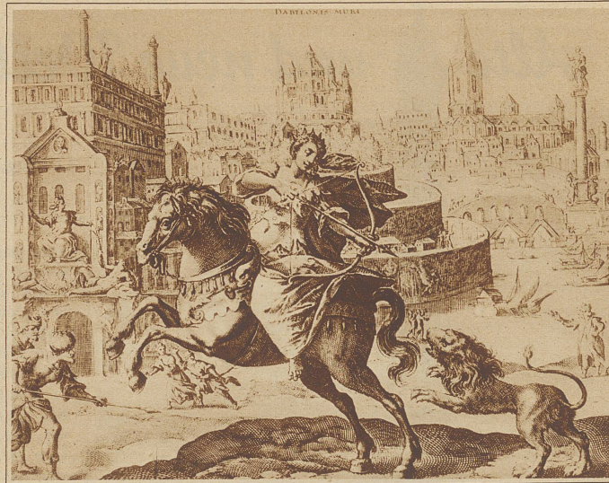
Die hängenden Gärten von Babylon, deren Schöpferin die sagenhafte Semiramis gewesen sein soll. Im Vordergrund Semiramis zu Pferd, mit dem Pfeil auf einen Löwen schießend

inschriften. In Babylonien gab es übrigens in jeder größeren Stadt Stufentürme, die religiösen und militärischen Zwecken dienten. Die Angaben über den Babylonischen Turm schwanken zwischen