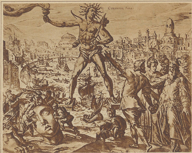
Der Koloss von Rhodos, unter dessen Beinen durch die Schiffe mit vollen Segeln ein- und ausfahren konnten

Helios, die 34 m hoch war. Diese Statue, richtiger gesagt, dieser Koloss war über dem Eingang zum Hafen errichtet. Chares, ein Künstler aus Lindos, hatte die Statue in Metall gegossen und nach zwölfjähriger Arbeit vollendet. Ein Erdbeben stürzte das Wunderwerk ein halbes Jahrhundert später um. Als die Araber im 7. Jahrhundert n. Chr. die Insel Rhodos eroberten, verkaufte der mohammedanische Feldherr die Kolossrümpfer an einen Händler von Edessa, der zur Wegschaffung des Erzes 900 Kamele benötigte. Ein ehemaliger Sonnengott auf Kamelen verladen — ist auch ein Witz der Weltgeschichte. Der Leuchtturm von Alexandrien war unter den wenigen Leuchttürmen des Altertums der berühmteste. Das angeblich 170 m hohe Bauwerk wurde