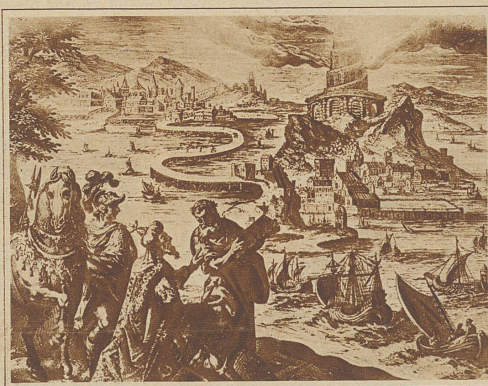
Der Leuchtturm von Alexandrien

und berechnet, um wieviel unser heimatliches Gestirn aus dem Schwerpunkt gekommen wäre, wenn man diesen Bau «bis an den Himmel» vollendet hätte. — Wohl das berühmteste Labyrinth des Altertums stand auf der Insel Möris in Aegypten. Es war um das Jahr 2200 v. Chr. ganz aus Marmor erbaut und soll in seinem gewaltigen Innern 3000 Gebäude, die sich zu 12 palastartigen Gruppen zusammenschlossen, enthalten haben. Inmitten dieser Herrlichkeit der 12 Paläste lag ein großer Irrgarten, der nur einen Eingang besaß. / Heute im Zeitalter der Technik haben