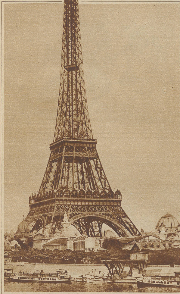
Eiffelturm, erbaut in den Jahren 1887-89 vom Pariser Ingenieur Gustave Eiffel. Höhe 300 m. Der Unterbau des Turmes ruht auf Betonklöben von 676 m 2 Grundfläche. Der Turm wiegt 9 Millionen kg. Die erste Plattform liegt 57,63 m, die zweite 115,73 m über dem Erdboden. Bis zur Spitze führen 1792 Stufen