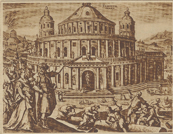
Der Tempel zu Ephesus

wir uns an andere Weltwunder — das heißt, wir nehmen sie heute geradezu als Selbstverständlichkeiten hin —, wie zum Beispiel Wolkenkratzer, Riesenbrücken, Türme von gewaltiger Höhe, Sendestationen, Riesenkraftwerke und nicht zuletzt unsere leistungsfähigen Groß-Fahrzeuge, gewöhnt.