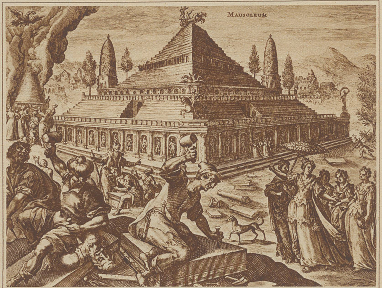
Das Mausoleum, ebenfalls eines der sieben Weltwunder, wurde im 3. Jahrhundert durch ein Erdbeben zerstört

ferin die sagenhafte Königin Semiramis gewesen sein soll, verdanken ihren Weltruhm den märchenhaften Angaben griechischer und römischer Schriftsteller. Neuerdings vorgenommene Ausgrabungen ergaben die starke Uebertreibung und phantastische Ausschmückung jener Berichte. Gegenwärtig werden die Ziegel der ehemaligen Grundherrlichkeit als Material zu einem Euphratwehre verwendet. Zeichen der Zeit! — Im Jahre 336 v. Chr.,