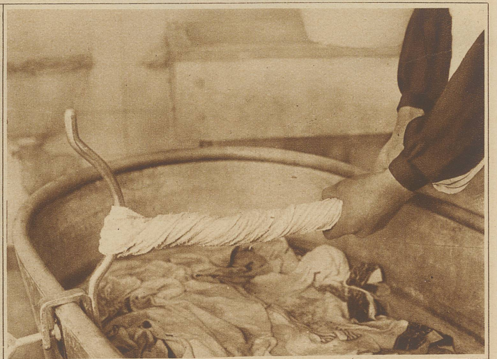
Ein praktischer, einfacher Hilfsapparat zum Auswinden von Wäsche. Der anschraubbare Metallhebel ist vor kurzem als «Neuheit» in den Handel gekommen. In ihrem Prinzip war diese Einrichtung aber bereits den . . . . alten Aegyptern bekannt