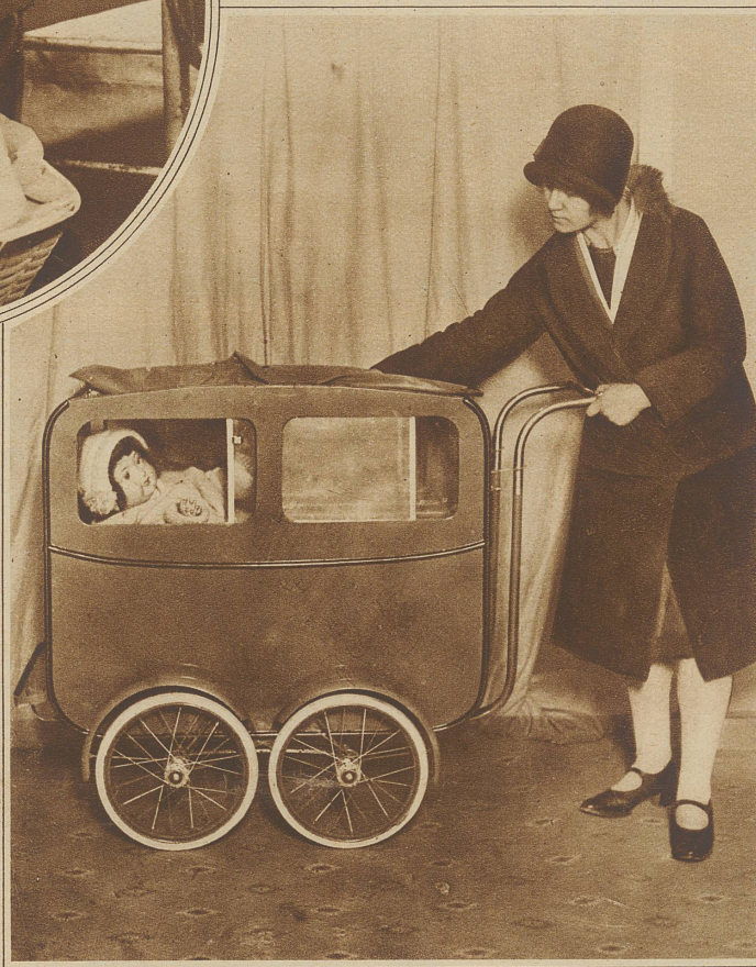
Ein neuer englischer Schönwetter- und Regen-Kinderwagen mit verstellbarem Dach und Schiebefenstern

benen Etikette – im Badezimmer, auf der Winde oder sonst einem geeigneten Platz nebeneinander auf. Jedes abgelegte Wäschestück wird in den ihm bestimmten Beutel getan und damit schon eine halbe Stunde Zeit gespart, die sonst für das Sortieren verbraucht wird. Auch braucht man auf diese Weise nie lange zu «suchen», wenn einmal ein Stück rasch