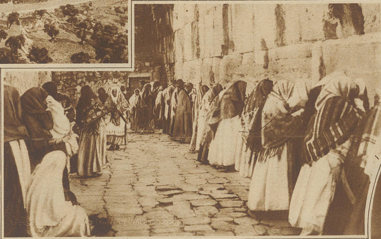
Die Klagemauer der Juden

Kamele plötzlich den Durchgang auf Minuten verunmöglichen, belebt von hockenden, feilschenden Juden und Arabern, prächtig-stolzen Beduinengestalten, denen das Unabhängigkeitsgefühl aus den Augen strahlt, neugierigen, amerikanischen Reisenden, welche möglichst viel sehen und möglichst wenig erklärt haben wollen, von frommen Pilgern, die am Ziele ihres langjährig gehegten Wunsches ganze Berge von Devotionalien zusammenkramen, wo Bazarinhaber unermüdlich zur freien Besichtigung ihrer Waren einladen, ist eine Welt für sich.