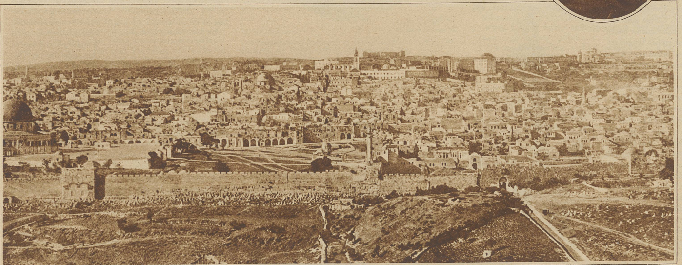
Jerusalem vom Oelberg aus gesehen