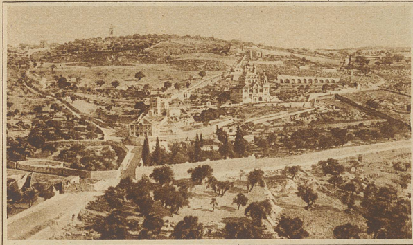
Der Garten Gethsemane am Oelberg; rechts oberhalb der Bildmitte die russisch-orthodoxe Kirche

den Juden geheiligten Stätte nähert, ertönen eindringliche Klagelaute aus Hunderten von Kehlen durch die Luft, in den engen Gassen ein verworrenes, fast unheimliches Echo auslösend. Der Anblick dieser Trauerszene erweckt auch im Nichtjuden ein Mitgefühl. Jüdische Frauen mit farbigen Kopftüchern beten in wimmerndem Tone und hämmern ihre Köpfe an die Mauer, Rabbiner in leuchtenden Samtgewändern und Pelzmützen lesen, mit dem Kopf gegen die Klagemauer gelehnt, aus der Thora, andere im langen Kaf-tan wehklagen in rhythmischen Bewegungen und schlagen mit geballten Fäusten an die wuchtige Quader-mauer, die letzten Reste des salomonischen Tempels, indem sie ihre Oberkörper in schnellem Tempo vor- und rückwärtsbewegen, an die Gebetweise koranzitierender Moslemin in der Moschee erinnernd. * Die Klagen um die verlorene Herrschaft Jerusalems und das Nichteintreffen des verhei-