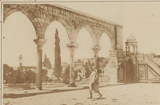
Eine der vier aus der Zeit der Kreuzzüge stammenden Arkaden, die die Omar-Moschee umstellen

ein befreiendes, versöhnendes Gefühl aus. Die verschwenderisch reiche Innen-Ornamentik, die gewaltige Kuppel, die rundbogigen Arkaden, die prachtvolle Form und Macht des Octogons mit seinen farbenbunt leuchtenden persischen Majoliken, der majestätische Platz, dessen wuchtige Größe durch die engen, angrenzenden Gassen vor dem Auge des Besuchers um so plastischer erstet, bildet vom Standpunkt des Kunstfreundes den ungetrübtesten Ge-