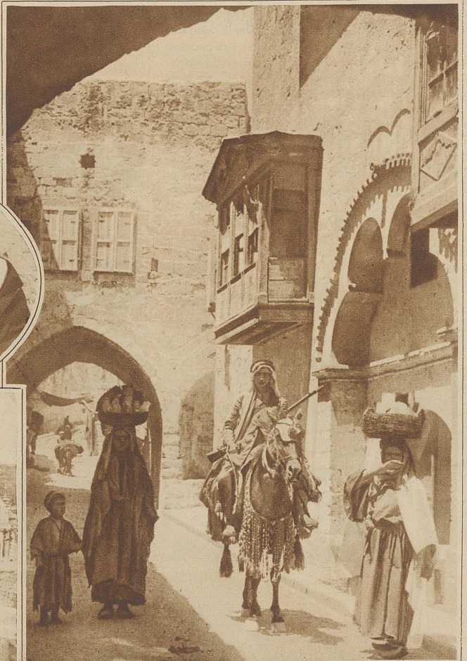
Straßenbild aus Jerusalem