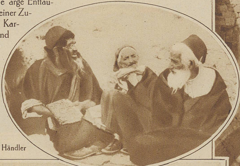
Rechts im Oval: Jüdische Händler

Eine eigenartige Stadt, dieses Jerusalem, gewissermaßen religiöse Kapitale der führenden monotheistischen Religionen; für Christen, Juden und Mohammedaner gleich verehrungswürdig; für den christlichen Besucher jedoch eine arge Enttäuschung. Er wird eigentlich nicht recht froh seiner Zugehörigkeit zur christlichen Gemeinschaft; Karfreitagssweifel umfassen seinen Geist und nach wenigen Tagen Aufenthalt an den hl. Stätten wird es ihm klar, warum Mohammedaner und Juden mit derselben bald offenen, bald versteckten Verachtung auf das Christentum blicken. An keiner Stelle der Welt, trotz gleißender Lampen und pomphafter Zeremonien, fühlt man den Geist des erhabenen Schöpfers des Christentums