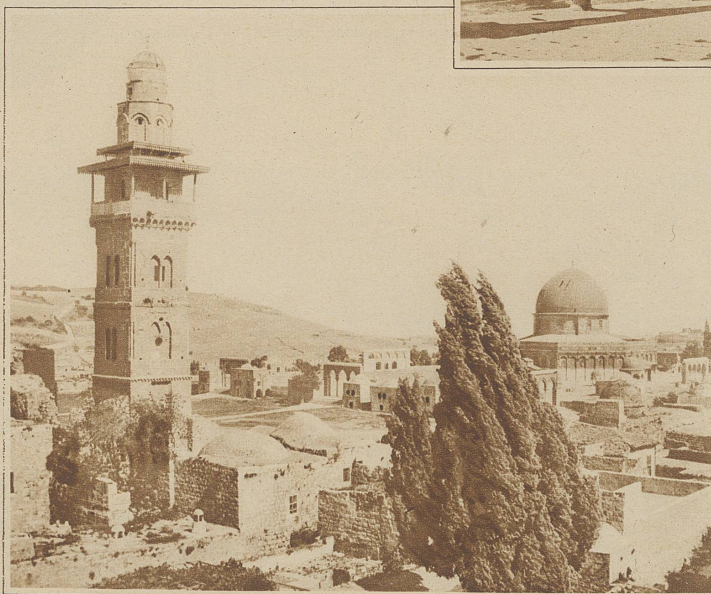
Blick auf die berühmte Omar-Moschee (rechts im Bilde), eines der schönsten Denkmäler islamitischer Baukunst

weniger als in Jerusalem und Bethlehem. Wie ganz anders empfindet man die lichte, heilige Erlösgestalt des Nazareners in einer kleinen, einfachen Bergkapelle, unbelastet von dem beinahe zur bloßen Form erstarrten Erinnerungskult Jerusalems. Trotz dieser herben Enttäuschung und der Beschämung, die man bei diesem ewigen Hader der vielen christlichen Konfessionen um die hl. Stätten empfindet, bleibt Jerusalem die Wiege der Christenheit, aber auch Heimatstadt des Judentums und eine feste Burg des Islams. * Besonders ein Monument umschlingt die verschiedenen Religions-Systeme. Ein tröstendes hoffnungspendendes Moment an der entzweiten Menschheit; Christ, Jude und Mohammedaner haben dem großen Tempel seinen Charakter verliehen. Kein schönerer Bau ziert Jerusalem, als die in mohammedanischem Besitz befindliche Omar-Moschee, in welcher man die Architektur einer urchristlichen Kathedrale erkennt, die in noch früherem Zeiten Mittelpunkt des salomonischen Tempelbaues war. Der rauhe Felsen, auf welchem Abraham seinen Sohn Isaak zu opfern bereit war; allen drei monotheistischen Religionen gleich verehrungswürdig erscheinend, löst in seiner unbehauenen Form, lediglich von einer hohen Brüstung umgeben,