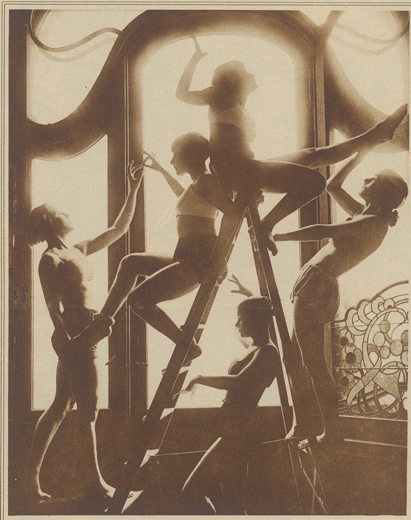
Tanzstudie der Schule Laban

das kleine Gehölz hastete, hörte er immer die Worte: Ich hasse dich — ich hasse dich!