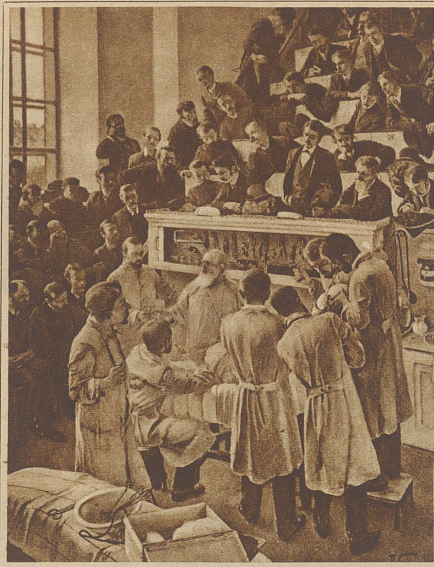
Billroths hundertster Geburtstag

«Oh doch!» Sie steckte vorsichtig die geputzte