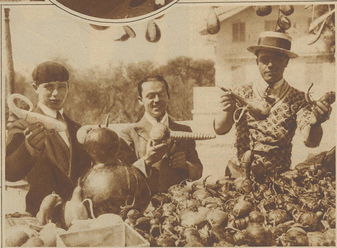
Buntbemalte Flaschen, Gefäße, originelle Figuren, alles aus Kürbissen

«Nein, das glaubst du nur so. Halt mir das ein wenig. Das andere Ende, du Schaf, sonst schneide ich dich. Nein!» rief er, als sie in ihrem Eifer, ihm zu helfen, sich ungeschickt anstellte, «hier, so — oh! macht nichts, es liegt nichts daran!» Seine Ungeduld und der Wunsch, es recht zu tun, hatten sie