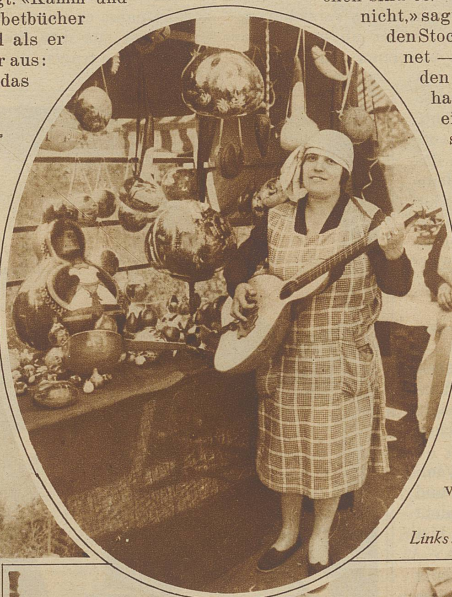
Links: Ein reich assortierter Stand

Das Fest des Kürbis, das früher in Nizza als eines der größten Volksfeste gefeiert wurde, findet noch alljährlich bei der alten Arena in Cimiez statt, ist aber leider trotz seiner besonderen Originalität in den letzten Jahren etwas in Vergessenheit geraten. Es ist kein Erntefest, wie man im ersten Moment denken könnte, sondern eher eine Art Kunstausstellung. Aus den getrockneten Kürbisschalen werden alle möglichen Gegenstände hergestellt und mit kunstvollen Malereien oder Kerbarbeiten versehen, an denen oft Tage und Wochen gearbeitet worden ist, eine wahre Volkskunst, die wir fast ausschließlich in Südfrankreich und auf Korsika finden. Die Arbeiten werden dann jedes Jahr auf Ständen zum Verkauf angeboten, woraus sich das Kürbisfest entwickelt hat