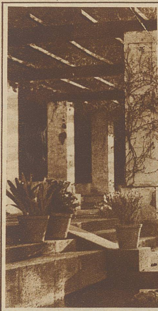
Gartenlaube im Park Mont-Juich