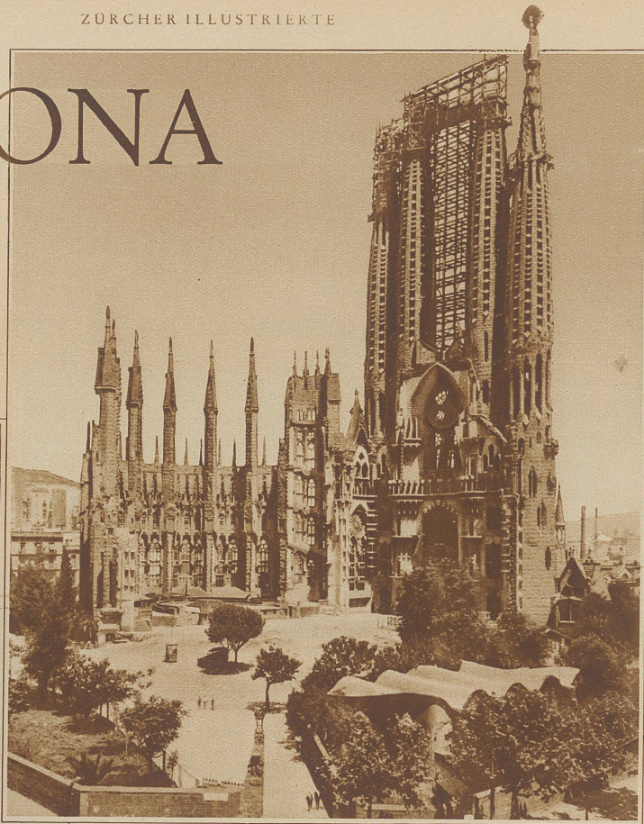
Der Tempel der Heiligen Familie, dessen Bau nur durch freiwillige Beiträge finanziert wird

«Ist das Spanien?». So frägt wohl jeder angenehm enttäuscht, der mit Barcelona die erste spanische Stadt betritt. Breite Straßenzüge, lebhafter Verkehr, hochmoderne Bauten, verschwenderische Lichtfülle und kräftig pulsierendes fröhliches Leben sind hier nicht nur Attribute der Millionenstadt, sondern erheben Barcelona in jeder Hinsicht auf das Niveau mitteleuropäischer Weltstädte. Dazu darf Barcelona noch die südliche Sonne