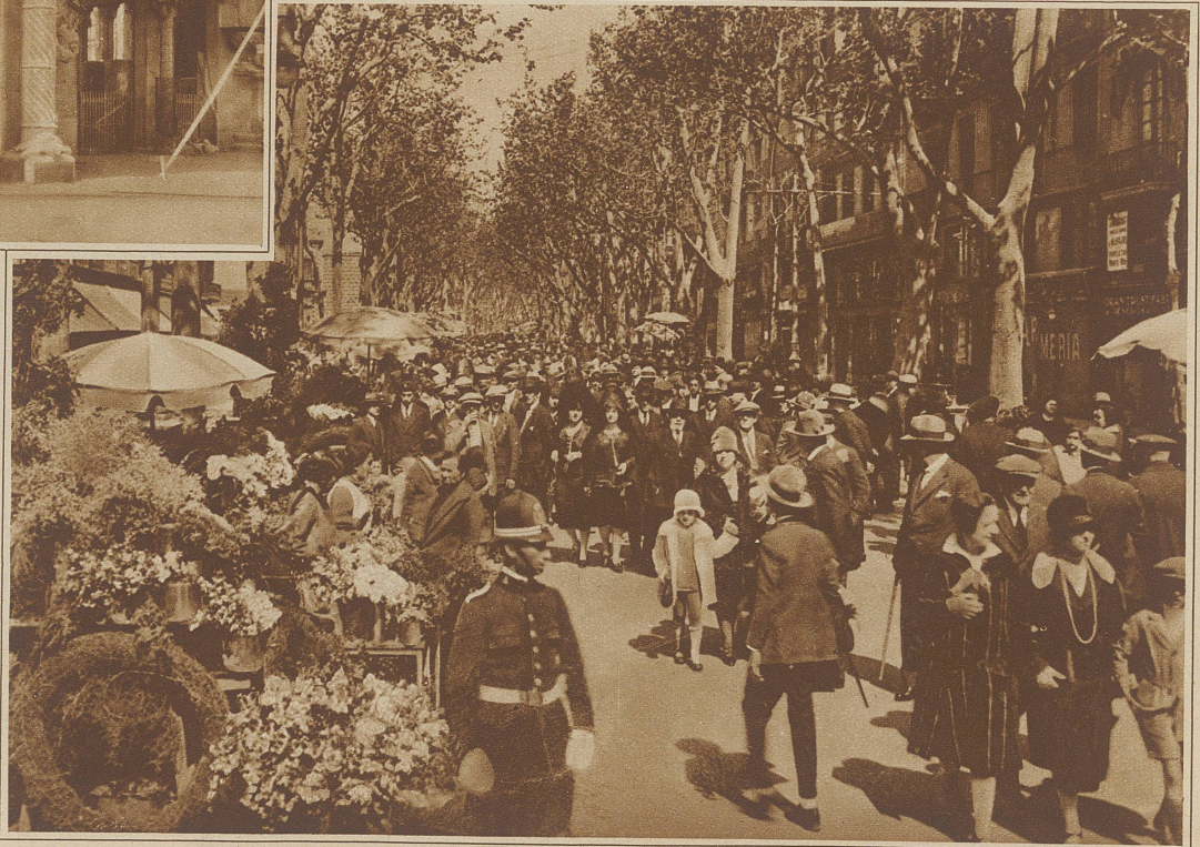
Bild rechts: Die Rambla ist die schönste Straße Barcelonas; sie gehört, wie das Bild zeigt, in ihrem mittleren Teil ausschließlich dem Fußgänger.

und das ewige Grün für sich buchen. + Die modernen Viertel wirken mit ihren schachbrettartigen Straßenanlagen etwas nüchtern. Die Altstadt dagegen mit den vielen krummen und engen Gassen offenbart in Architektur, Sitten, Trachten und Gerüchen noch viel typisches spanisches Leben. Mitten durch die Altstadt zieht sich die schönste Straße von ganz Spanien: die Rambla. Sie gehört auch im Zeitalter des Automobilismus noch größtenteils dem Fußgänger. Ihm ist die breite Allee in der Mitte reserviert.