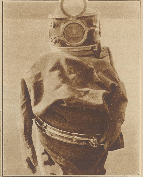
Der komplette Rettungsanzug

dem Platz für Notproviand. Am Gürtelring wird der Anzug durch einen Hebelgriff geschlossen. Der Kopfschutz sieht dem Helm eines Tauchers ähnlich und ist mit Ventilen ausgestattet, durch die die Luftzufuhr reguliert wird. Eine bewegliche Klappe ermöglicht das Einatmen von frischer Luft. Die freibeweglichen Arme können noch ruderartig bewehrt werden, wodurch natürlich die Rettungsmöglichkeit auch noch erhöht wird. In diesem Anzug kann man aus beträchtlicher Höhe einen Sprung ins Wasser tun, ohne in die Gefahr des Untersinkens zu geraten und man wird so lange auf der Oberfläche verbleiben, bis mit ziemlicher Sicherheit Hilfe zu erwarten ist.