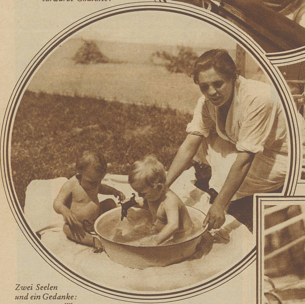
Zwei Seelen und ein Gedanke: Wasser

Nebenstehendes Bild links: Gestürm und Gedräng im Laufgitter