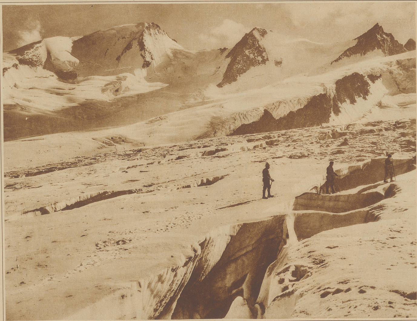
Auf dem zerrissenen Walliser Fiescher-Firn