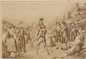
Schwingfest auf der Rigi

grösste Wespennest hinweist, von der der Volkssmund behauptet, ihrer sieben Können mit den Stichen ein Roß umbringen; die brummend und surrend und schwirrend wie kleine Teufel durch die Luft sausen und wo sie hinkommen, Aufregung und Erschrecken verursachen. Ähnlich ist das Lärmen des Horns im gleichnamigen Spiel.