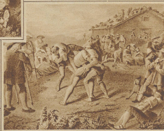
J. Schwinger J. Bodmann

so daß die Punktzahl 10 einer Streichlänge von 100—170 Meter entspricht. Wie man aus den wenigen Angaben sieht, ist das Hornsamen ein typisches Zweikampfspiel, bestehend aus Schläger und Ahter. Bei Festen wird die Gegenüberstellung zum Beginn durch das Los bestimmt. Den eigenartigsten Einfluß von den Hornsamenspielen erfährt man, wenn man sie im Festzug sieht. Wenn