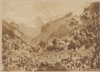
Hornfest zu Unspunnen 1808

Während man nun zum Schwärzen in der Hauptsache nichts als starke Glöcker braucht und Obelassenskiit, so sind zum Hornsamen einige Gerätschaften notwendig. Nämlich vor allem der «Hornas», eine gedrechselte, gewölbte Scheibe aus Buchsbaumwurzel oder Buchsbaumholz, aus Hartgummi oder Celluloid mit Blasenlage, von etwa 6 cm Durchmesser und 2,7 cm Dicke. Ferner ein geschwelliger Hornsstocken oder Schläger aus zähem Eschenholz, 2 bis 2½ Meter lang, der an der Spitze mit einem Klötzchen, dem «Fris», aus zähem Buchenholz, versehen ist. Dann ein «Bock», ein eisernes Gestell von 1½ Meter Länge mit zwei niederen Beinen vorne, während der Schwanz die Erde berührt, der also nach vorne aufgebogen ist. Und schließlich die Schindel, ein quadratisches, hölzernes Brett von 50 bis 60 cm Seitenlänge und Stiel. Beim Spiel wird der Horns mit etwas Lehm an der Spitze des Bockes festgeschicht, worauf gegen ihn ein so heftiger Schlag ausgeführt wird, daß er 200, nicht selten aber auch 270 bis 280 Meter hoch in Bogen durch die Luft fliegt. Der Zweck der Übung ist nun der, daß der Horns von der sog. «Ahter-Partei» (im Gegensatz zur Schläger-Partei) an seiner Flugbahn behält, d. h. catagons wird, indem man ihm die Schindel entgegenhält