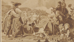
Schwingen auf dem Halsberg

das ist schön! — Schön ist aber auch das «Fahnen-schwingen». Welche herrlich farbige Lebendigkeit bringt es nicht auf den Schwingplatz und welch froher Kontrast ist doch zwischen seiner behenden, fliegenden Schwunghaftigkeit und der bedächtigen, mit dem Boden verwachsenen Schwingerarbeit! Wie sich die Fahne aus den Händen des Mannes in die Luft schwingt, wie sie sich dreht und kurzelt, wie sie raschelt, knistert und fattert, sich sieghaft zur Sonne schwingt, aufgefangan wird, um endlich wie ein müder Vogel seine Flügel einzuziehen und auszuruhen, das ist schön, schlichte Volkskunst im wahrensten Sinne, das ist ein herz- und angerührtes Anblick voll Fröhlichkeit und Ehrlichkeit.