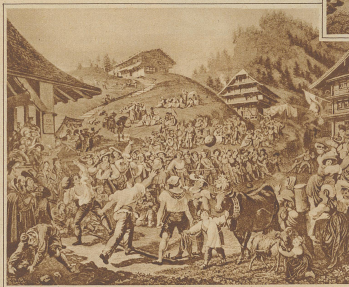
Das Steinstoßen auf Rigi-Klosterli

so daß die Punktzahl 10 einer Streichlänge von 100—170 Meter entspricht. Wie man aus den wenigen Angaben sieht, ist das Hornsamen ein typisches Zweikampfspiel, bestehend aus Schläger und Ahter. Bei Festen wird die Gegenüberstellung zum Beginn durch das Los bestimmt. Den eigenartigsten Einfluß von den Hornsamenspielen erfährt man, wenn man sie im Festzug sieht. Wenn