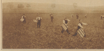
Hornsamens. Gegenwärtige Unternehmung der Ahter-Partei, die durch vorg. redieren die Schindel dem Horns entgegenhält

Daß auch das Jodeln ein keimig Eder, Schwing- und Aelperfest fehlen darf, ist daher selbstver-