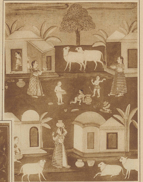
Dorfzene. Die Köpfe der spielenden Kinder haben nicht die mindeste kindliche Ausdrucksform und könnten ebensogut erwachsenen Personen aufgesetzt werden

«Vielleicht ist es interessant,» erwiderte er. «Siehst du, meine erste Frau, Blanche de Clairefontaine, war sehr schön, das weißt du, solch feine, fast überkultivierte französische Schönheit, wie man sie selten sieht... Aber Renée Serano, meine zweite Frau, war auch hübsch, ein ganz anderer Typus, dunkel, südlisch, geschmeidig, herrlich anzusehen. Und dann Didi, meine dritte. Das war einfach ein Wunder der Schönheit! Männer und Frauen drehten sich auf der Straße um, um ihr nachzusehen.