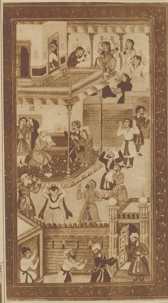
Indische Miniatur aus dem 17. Jahrhundert, den Inhalt einer Novelle darstellend

«Richtig,» fuhr Frans Vandome unbeirrt fort, «geschieden. Seit einem Monat. Und nun treibe ich mich ein bißchen herum, um mich auf andere Gedanken zu bringen, und gerade gestern bin ich zu der Erkenntnis gelangt, daß ich nur noch eine Illusion habe...»