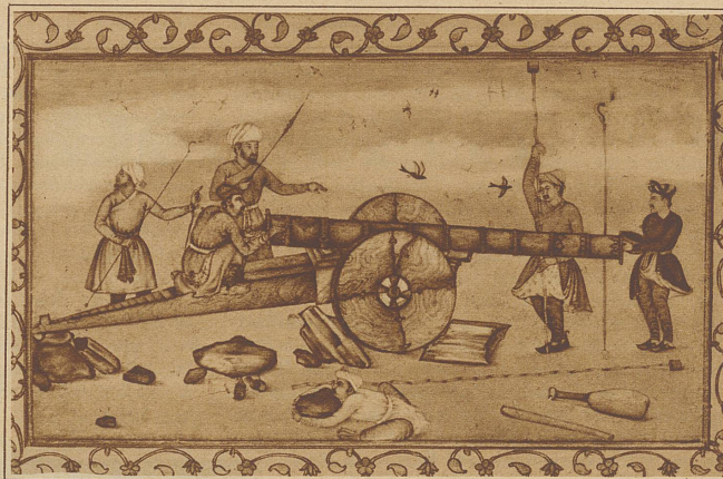
Darstellung einer Kanone. Diese Miniatur aus dem 18. Jahrhundert zeigt schon deutlich den europäischen Einfluß

Bild links: Im Harem. Während die Damen des Hauses Kaffee und Likör trinken, tanzen zwei junge Mädchen nach der Musik einiger Dienerinnen