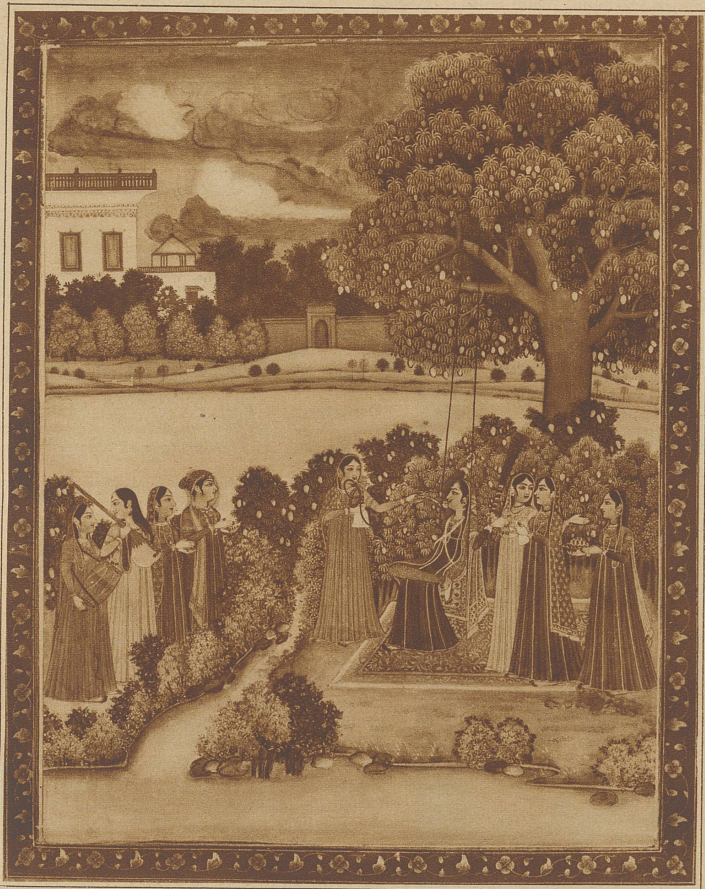
Perstische Fürstin, die Wasserpfeife rauchend. Links im Bilde vier musizierende Dienerinnen

Die Miniaturmalerei ist in allen Kulturgebieten bekannt und sie tritt immer dann am deutlichsten und häufigsten in Erscheinung, wenn die