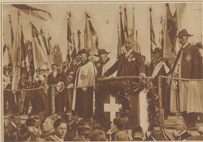
Regierungsrat und Nationalrat Dr. O. Seiler aus Liestal bei der packenden und glanzvollen Festrede