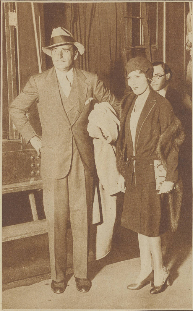
Douglas Fairbanks und Mary Pickford, die zwei beliebtesten, weltbekanntesten und wirklich sehr sympathischen Filmsterne, finden es in Paris zurzeit überaus heiß und wollen schleunig in die Schweiz weiterreisen. Douglas Fairbanks und Mary Pickford beim Umsteigen in einem Pariser Bahnhof