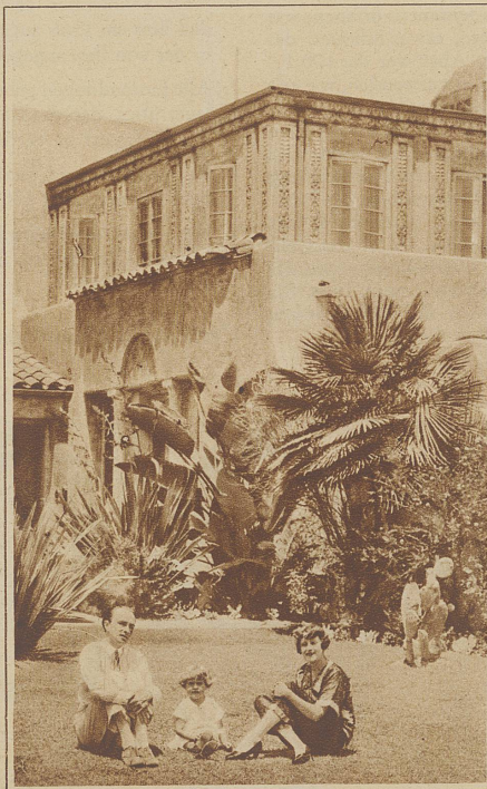
Conrad Veidt mit Familie im Garten seiner Villa in Beverly Hills bei Hollywood

(Aus dem demnächst erscheinenden Buch des Verfassers: «Hollywood, die Stadt der Illusionen».)