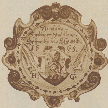
Sie haben sich gefunden. Das Schild über der Haustür in Wetzikon

Oder, um einen kühnen Sprung zu machen: von der Philosophie, der Weisheit, zu ihrem