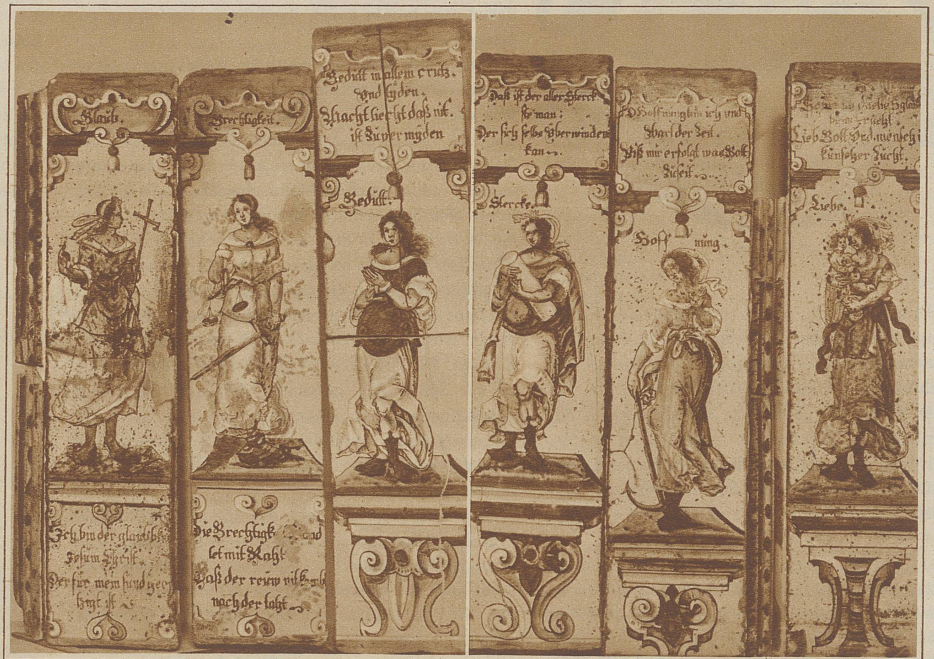
Darstellung der Kardinaltugenden (Glaube, Gerechtigkeit, Geduld, Stärke, Hoffnung, Liebe) auf prunkvollen Kacheln

Besonders bemerkenswert unter den Erzeugnissen Schweizer Volkskunst, die in Berlin aufbewahrt sind, erscheinen auch die Gegenstände des täglichen Gebrauchs. Da sind Milchkübel aus dem 18. Jahrhundert, kunstvoll geschnitzt und geschmückt, wie sie in unserer herzlosen und rationalisierten Epoche gewiß nicht mehr hergestellt werden. Oder der «Kleiekotzer», hinter welchem nicht gerade romantischen Namen ein kunstvolles Ornament sich verbirgt, das die Müller verwendeten. Durch den weit-aufgerissenen Mund rieselte die vermahlene Kleie herab. Jeder Kasten, jede Truhe, jedes Blatt ist ein wahres Kunstprodukt. Im Museum ist eine Stube aus all diesen Gegenständen zusammengestellt. Nicht einmal reichsilierte Nußknacker fehlen. Oder Arbeiten der Töpferei, wie sie einmal in Thun besonders gepflegt wurde. Oder eine Brautkrone von einem heute geradezu phantastisch anmutenden Reichtum. Das Kabinettsstück, wenn man so sagen kann, bildet die gekachelte symbolische Darstellung der Kardinaltugenden: Glaube, Gerechtigkeit, Geduld, Stärke, Hoffnung, Liebe. Die siebente, die Mäßigkeit, fehlt. Aber das soll — ausnahmsweise — gewiß kein Symbol sein.