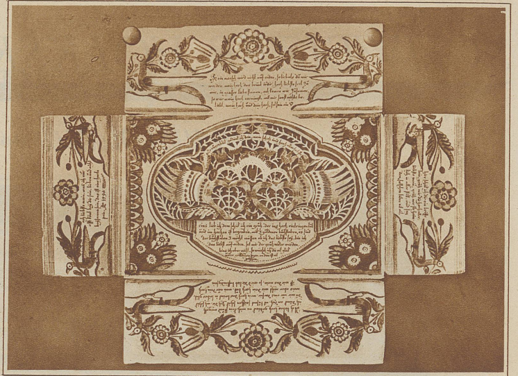
Liebesbrief aus Wetzikon in Form eines Scherenschnittes (Siehe Artikel)

Das Herz müssen sie damals in Wetzikon überhaupt stark strapaziert haben. Ein Konkurrenz-künstler, dessen Werk nun auch im Museum ruht, malt Trauben als Symbol der Zärtlichkeit, Hennen, die Fruchtbarkeit bedeuten und einen Hahn, der einen guten Tag einkräht und reimt dazu: «wan ihr mich liebt, vom hertzen fein, so soll mein hertz auch offen stehn, dann weil ich läb auf dieser erden, niemand als ihr so lieb sol werden. . . »