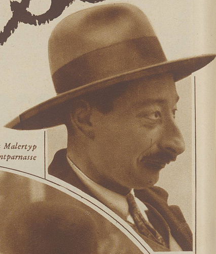
Noch ein Malertyp von Montparnasse

Wer in Paris war, ohne einmal die zahlreichen Künstlerlokale und Kabarette des Montparnasse durchbummelt zu haben, der kennt nicht die Herrlichkeiten dieser schönen und bunten Stadt. Aller englisch-amerikanischen Invasion zum Trotz hat sich ein Stück echter Pariser Tradition hierhin retten und flüchten können. Hier gibt sich der Pariser natürlich und echt, eben rein pariserisch liebenswert, hier ist man ungezwungen heiter, ganz unter sich und huldigt lächelnd den Frauen und den feinen Künsten.