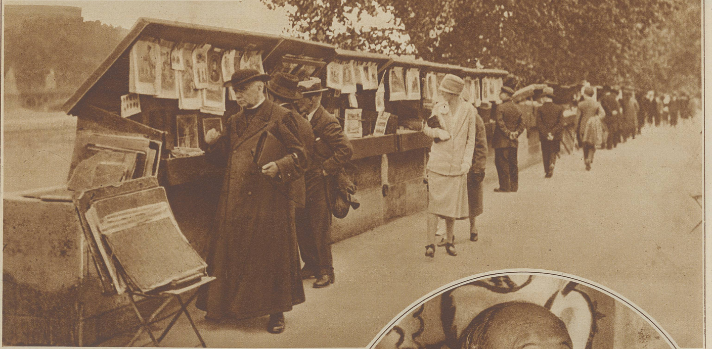
An der Seine. Bücherkasten am Pont St.-Michel

unterzutauchen. Markante, von Welt- ruhm blendend umstrahlte Köpfe geben sich lustig und gesellig ihr Stelldichein, so der reklametüchtige japanische Maler Foujita, der immer wieder die Oeffentlichkeit zu beschäftigen weiß, oder der holländische Salonlöwe Kees van Dongen, der Maler der vornehmen Gesellschaft. Aller Muse aber, der lebende Stern des Montparnasse, ist nicht die liebliche Mimi von einst, sondern Kiki, ehemals Modell, dann Malerin, dann kecke Schriftstellerin. Sie läßt sich nicht „bedichten“, wohl aber umschwärmen, feiern, in den Mittelpunkt stellen. Sie schreibt ihre eigenen Memoiren und wird selbständige Nutznieferin ihres Ruhmes. Denn Ruhm ist heute eine in