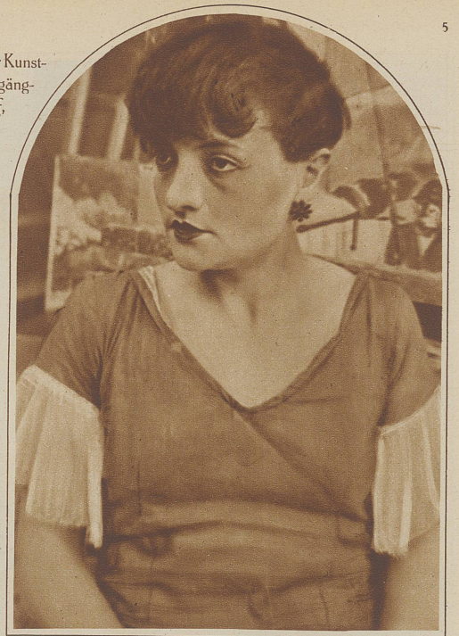
Modell von Montparnasse

Pariser Brotwagen. Eine alte Form, immerhin ist es möglich, daß er dem modernen Kinderwagen als Vorbild gedient hat