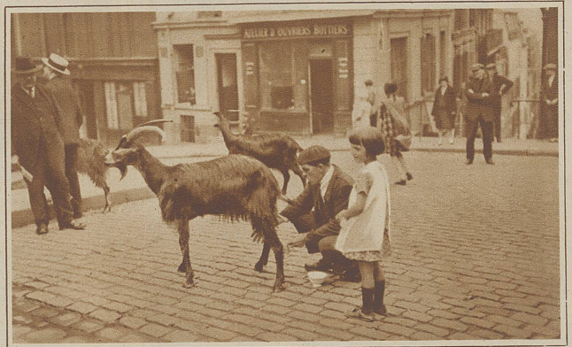
Ziegenmilch frisch vom Faß, Seitab von den glänzenden Straßen und rasenden Autos finden wir sie noch ab und zu, diese idyllischen Szenen in einer Weltstadt. Wie lange noch?