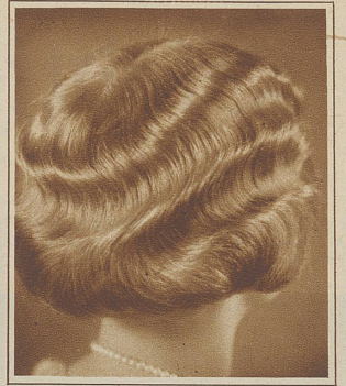
Das in Wasserwellen gelegte, naturgewellte schöne Haar

konkurrenz. Von solcher Bedeutung ist dies Wellenlegen, daß eine nach Tausenden zählende Besuchermasse sich zu dem interessanten Schauspiel drängte, wie 60 Konkurrenzteilnehmer an 160 Modellen ihr Können zeigten; allerdings auch in Phantasie- und historischen Frisuren.