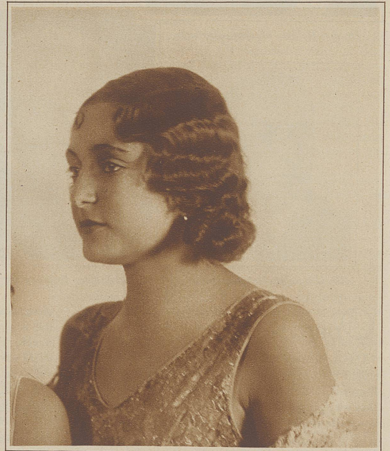
Ondulierte Frisur mit halblangen Locken