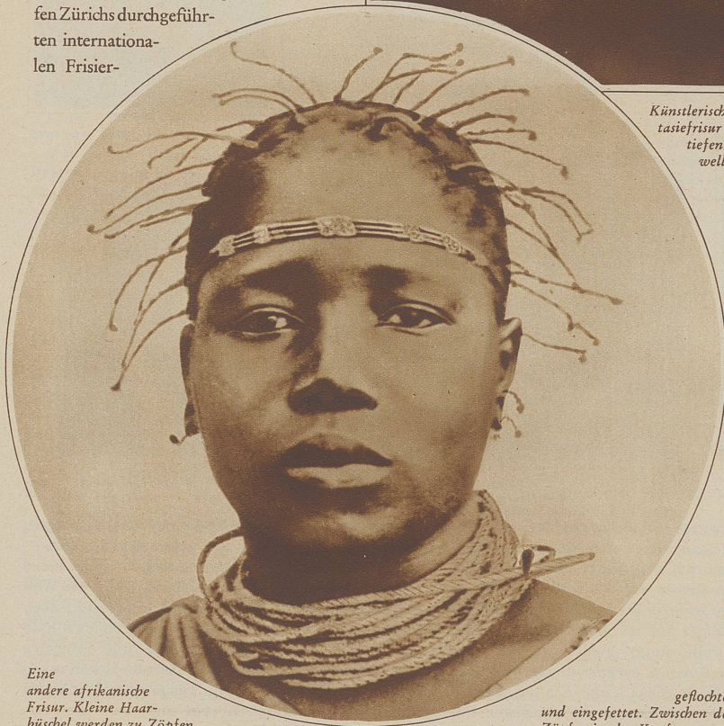
Eine andere afrikanische Frisur. Kleine Haarbüschel werden zu Zöpfen

Längst sind die Gegner des Bubenkopfes unter die Schweiger gegangen, denn längst ist kurzes Frauenhaar zeitgemäße Haartracht. Verstohlen tauchen auch unter den Grau- und Weißhaarigen immer mehr Bubenköpfe auf, und wo der Chignon noch vorhanden, da schmiegt er sich der Kopfform an, auf daß auch seine Silhouette nicht aus dem zeitgemäßen Rahmen falle. Männlichen Haarschnitt nachzuäffen — war Kinderart. Die «Welle», die schmeichelt, die auch den natürlichen Glanz schönen Haars reizvoll zur Geltung kommen läßt, verleiht auch dem kurzen Haar typisch weiblichen Charme. Auf solchen wieder bedacht, läßt sich der Bubenkopf — ganz individuell nach dem Nacken — das Haar in kleinem Spitz schneiden, und häßliche Rundschnitte über unästhetisch hochhinauf rasierte Nacken sind verschwunden.