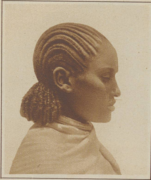
Ambara mit ihrer typischen Frisur. Damit diese besser hält und nur alle zwei bis drei Monate erneuert werden muß, wird das Haar mit Butter, im Innern Afrikas bei den Gallas sogar mit Kalmus eingetrichtert. Als Kopfkissen dient vielfach der Nackenschmel, der den Vorteil hat, das Kunstwerk, dessen Aufbau geraume Zeit beansprucht, nicht zu zerstören

lautet die aktuelle Devise für Bubenköpfe, vor der sich der spuckglatte Eatonkopf stillschweigend davonschlich. Ob er sich nicht betrogen sehen wird, in seiner heimlichen Hoffnung, daß die Frau sich seiner zu Beginn der nächsten Badesaison wieder erinnere?