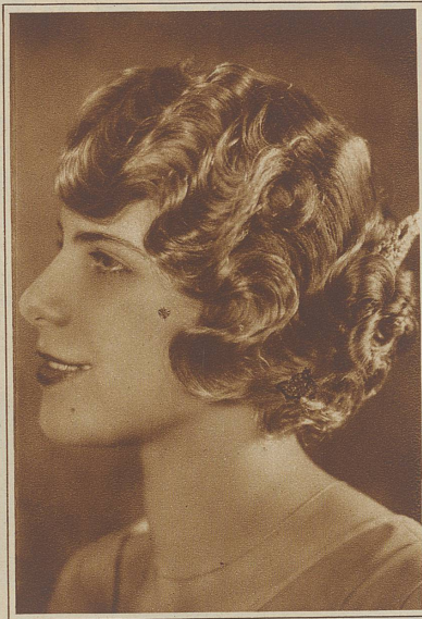
Mit sehr tiefen Dauerwellen kunstvoll frisiertes, langes Haar

stiche oder zur Phantasieperücke. — Und der in letzter Zeit viel genannte «Flapper-Kopf»? — Ja, Locken «machen» kann der Haarkünstler, aber für den Flapper-Kopf, da muß man selber Locken haben; das ist der Witz! Um so verwunderlicher, daß auch die in eleganten Großstädten viel getragenen «kurzen Locken» bei uns so rar sind. Ob daran die neue Hutmode schuld ist, die mit Südwestformen zierliches Gelock verdeckt und mit gefälten Rändern gar solches vortäuscht? — Ob man bei uns zu nüchtern für solche moderne Sinnigkeit — oder aber — ob unsere Frauen Angst haben, die Locken könnten eines schönen Morgens zum langen Zopf gewachsen sein? — Margrit.