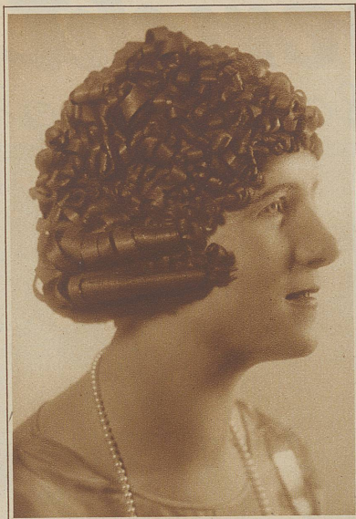
Die Phantasieperücke aus metallbespitzten, hellfarbigem Hobelspänen

Nur wem der Blick fehlt für feine individuelle Unterschiede, die ganz und gar von der Kopfform bestimmt sind, wird dem heutigen Kurzhaar Eintönigkeit zum Vorwurf machen. Denn wenn auch kurz, ist es doch immer lang genug, daß es sich in Wellen legen lassen kann. Und nicht nur kann die Wasser-, Dauer- oder onduierte Welle verschieden sein; es haben für gesellschaftliche Zwecke unsere Haarkünstler auch Phantasiefrisuren erdacht, so kunstvoll und natürlich wirkend zugleich, daß sich der Laie keine Vorstellung von der Schwierigkeit der Ausführung macht. Wer aber den eigenen Kopf zur feierlichen Verschönerungsprozedur nicht herhalten will, der greift zum Po-