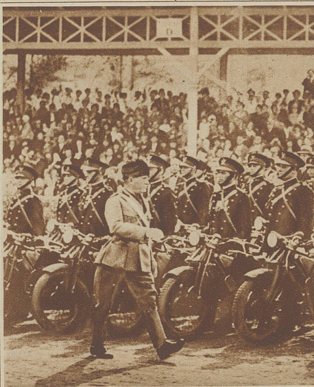
Das Haupt der Regierung vor der Front des Motorradfahrerkorps, das seinen 4. Gedenkttag feiert