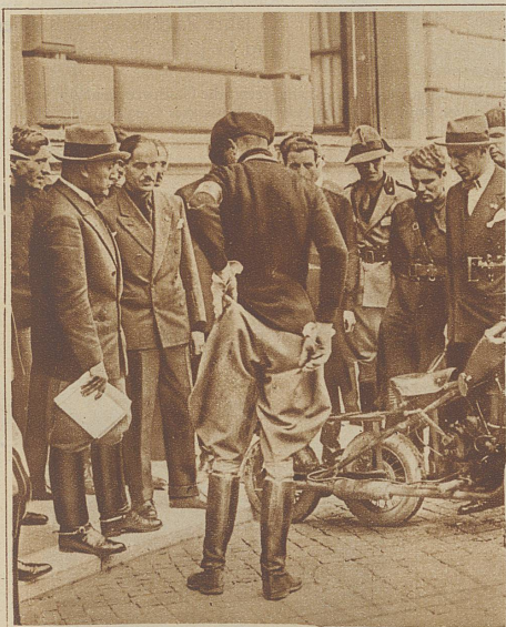
Altertümer auszugraben ist eine friedliche Beschäftigung. Man begnügt sich nicht mit ihr. Hier geht's um die Zukunft. Sie scheint nicht erreichbar zu werden. Mussolini besichtigt eine neue Kombination von Motorrad u. Maschinengewehr