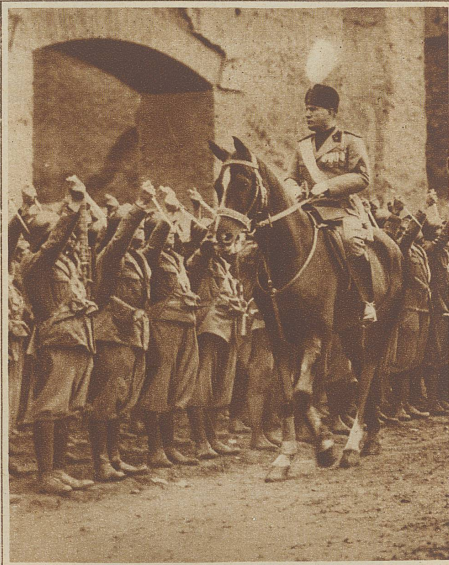
Mussolini besichtigt die neuesten Ausgrabungen und zugleich seine Miltz, die ihn freundlicherweise und auf neueste Art mit erhobenem Dolche begrüßt