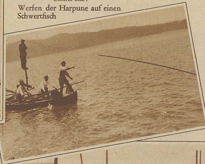
Unteres Bild: Werfen der Harpune auf einen Schwertfisch

das 2 bis 3 Zentner schwere Tier getroffen, geht es im Todeskampf erst auf den Grund. Die Fischer lassen das dünne Tau der Harpune soweit als möglich frei, während das Boot in der Strömung treibt. Erst wenn der Schwertfisch ermattet oder verblutet ist, kann er an Bord gezogen werden. Das Boot kehrt dann zum Beobachtungsschiff zurück und macht sich zur neuen Jagd bereit.