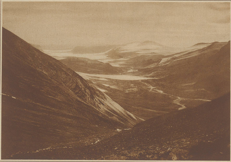
Das von den Gletschern der Eiszeit breitgewaschene Ladstjotal