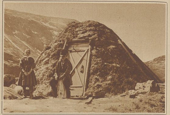
Lappenfamilie vor seiner Kote, aus Baumstämmen, Rinde und Torf aufgebaut

ander und mit den Ausfuhrhäfen Narvik auf norwegischem und Luleä auf schwedischem Boden durch eine elektrisch betriebene Bahn verbunden, die übrigens die längste und nördlichste der Welt ist. Diese Bahn schneidet die Strecke Stockholm-Naparanda in der kleinen Stadt Boden. Alles in allem wohnen etwa 20000 Schweden und Finnen in den genannten Städten. Das Land selber gehört den wenigen Lappen, den Renttieren – und den Mücken!