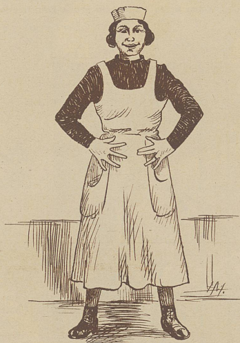
Die verlobte Oberschwester

Woran sind nun die 19271 Leser gescheitert, die bis auf zwei Paare alles richtig gemacht hatten? Fast alle an derselben Klippe! Sie haben den Säugling Nr. 4 zum Säugling Nr. 20 getan, anstatt zu Nr. 14, und Nr. 14 dann gezwungenermaßen mit Nr. 11 gepaart. Wer genau beobachtet, kann aber