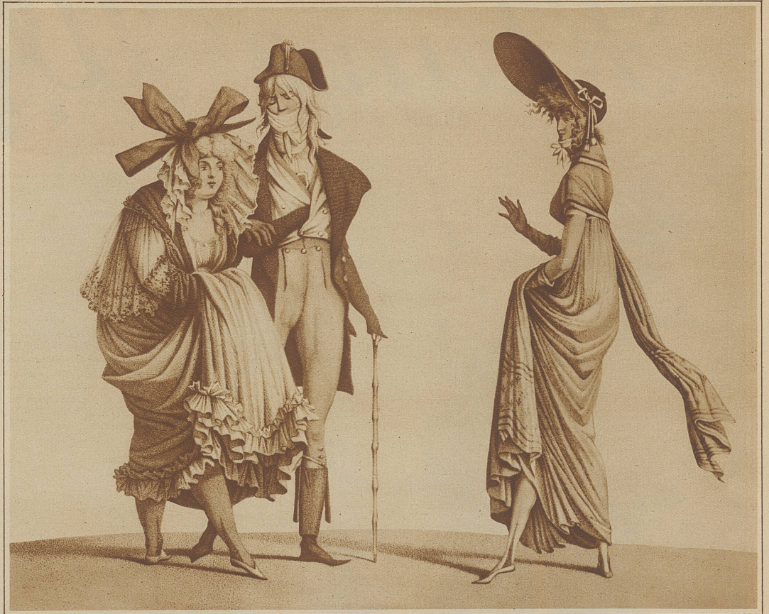
DIE «MERVEILLES» DES DIRECTOIRE

Für die Zürcher Illustrierte gezeichnet von BEER-DRECOLL, PARIS