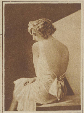
EIN RÜCKEN, DER NOCH IMMER MODERN IST

eine Stoffart beschränken, wäre wohl undenkbar. Selten oder nie hat wohl eine solche Scala von Stoffen der Mode zur Verfügung gestanden. Noch etwas wirkt harmonisierend mit unserm Modewandel. Nach langer Zeit wurde der flache Schuh eingeführt; aus Gesundheitsrücksichten, hieß doch der allgemeine begeisterte Ruf: Zurück zur Natur! Man ging so weit zur Natur zurück, daß die Damen nicht mehr gut «angezogen», sondern gut «ausgezogen» waren. Ein amüsanter Gesellschaftsspiel kam in jener Zeit auf: die Kleider der Damen zu wiegen! Soweit sind wir ja nun noch nicht und ich glaube, es ist auch darin kein Ehrgeiz vorhanden. Eu.