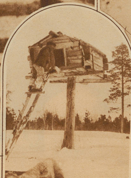
Der Speicher eines lappländischen Bauern steht, mit Rücksicht auf die räuberischen Füchse, auf Pfählen