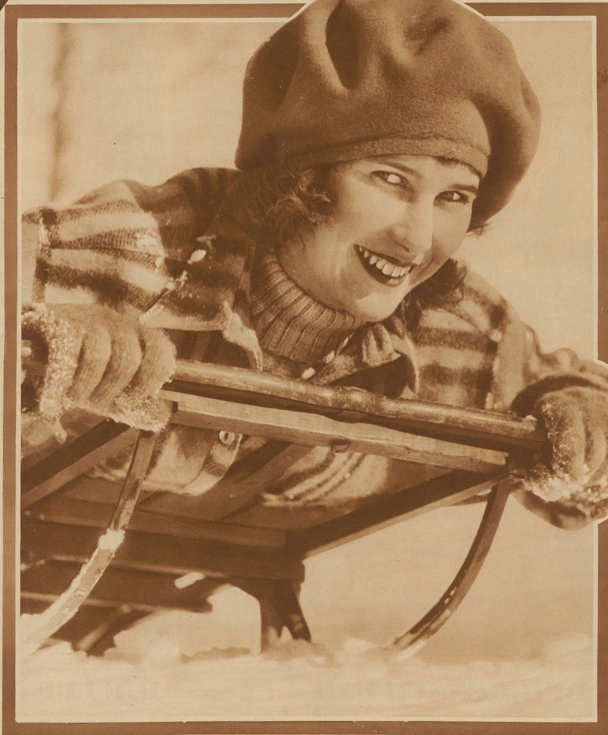
Ganz wie die Buben

Alleinige Anzeigen-Aufnahme durch die Aktiengesellschaft der Unternehmungen Rudolf Mosse, Zürich, 45 Cts. pro Millimeterzeile