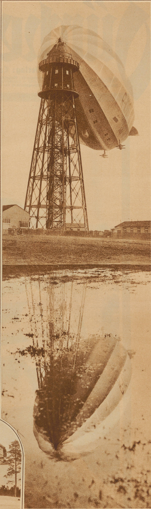
Das englische Luftschiff R 100 spiegelt sich am Mast in Cardington in den Wassern der großen Überschwemmung dieses Winters