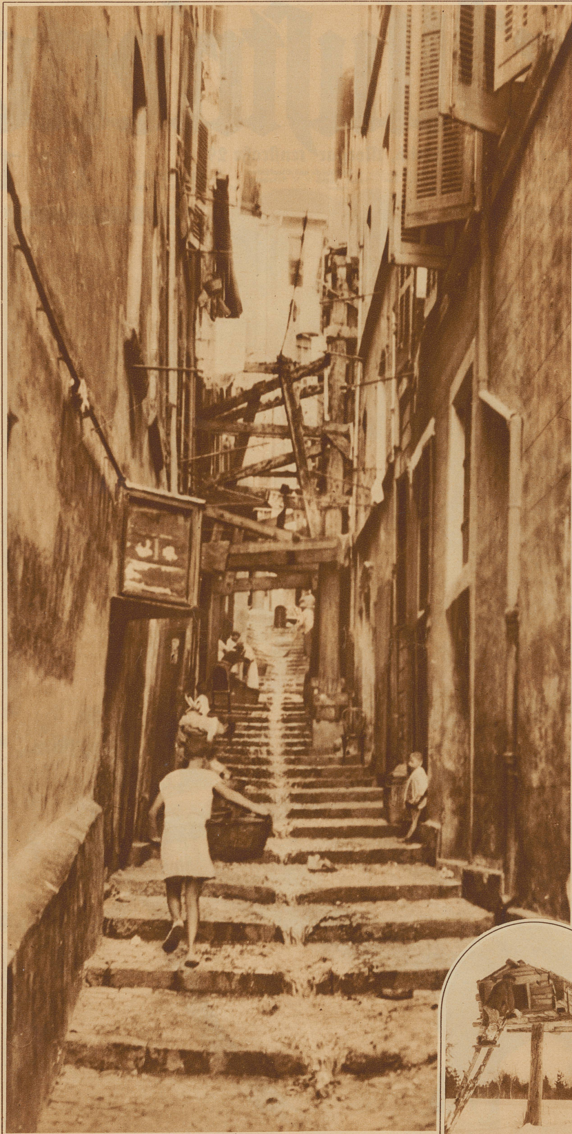
Marseille. Häuser der Altstadt, vom Einsturz bedroht