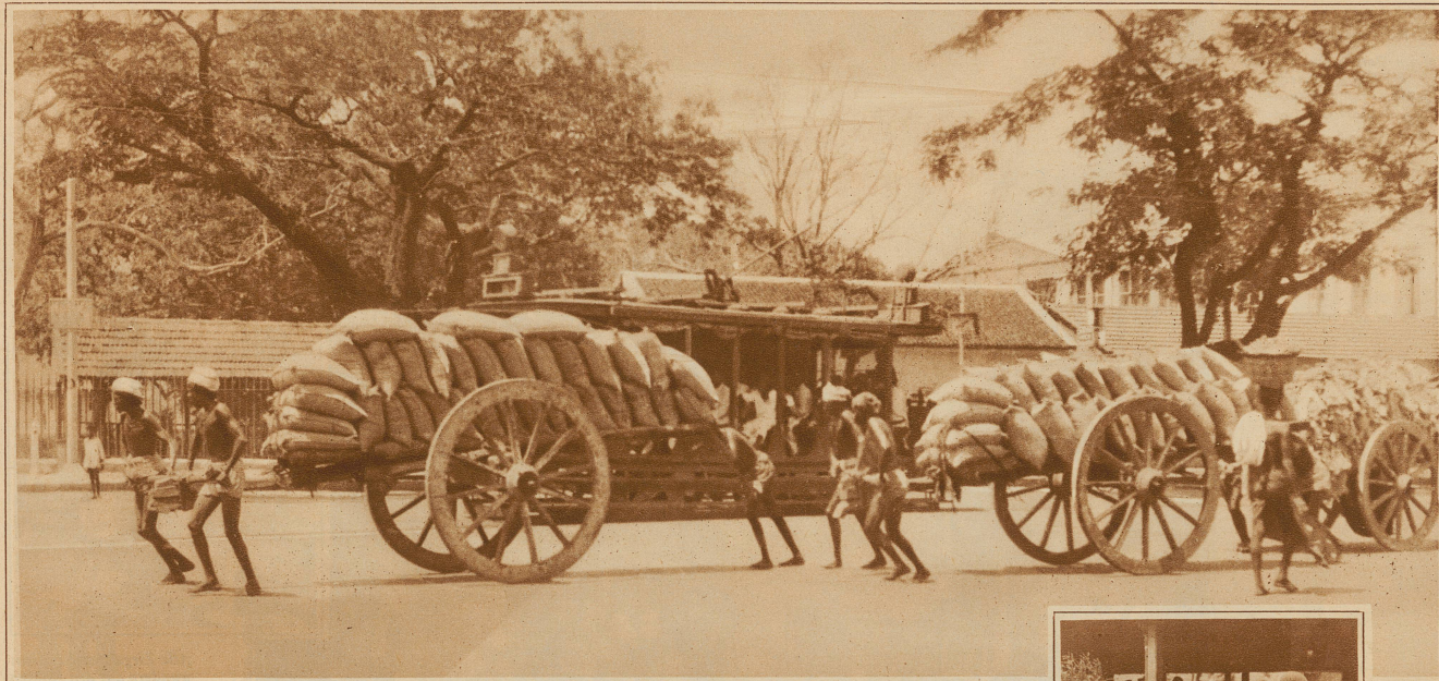
Menschen sind billiger als Zugtiere! Und drei Kulis schaffen zur Not soviel wie zwei Wasserbüffel

rer Arbeit kaum so viel aus dem Boden herausarbeiten können, als sie und ihre Familien zum kargen Lebensunterhalt brauchen. — Trotzdem gab es bis vor kurzer Zeit in Indien kein Proletariat im europäischen Sinne, weil es keine Industrie gab. Auf die «Pariabs», die «Unberühmbaren», die «Tschandalas» oder wie man sonst die tiefstehende Gruppe der sozialen Rangordnung Indiens bezeichnen will, paßt das Wort Proletariat nur sehr bedingt. Ihr Ursprung ist nicht wirtschaftlicher, sondern religiöser Natur. Die dreißig Millionen Pariabs sind kastenlos, stehen außerhalb der indischen Gesellschaft, führen ein Ghettodasein und sind durch diese soziale Achtung gezwungen, sich solchen Berufen zu widmen, die sie den untersten Klassen des europäischen Proletariats gleichstellen. Sie führen ein Helotendasein, ohne daß sie im eigentlichen Sinne Sklaven wären.