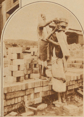
Alle Ziegelsteine Indiens wandern auf den Köpfen arbeitender Frauen an ihren Platz