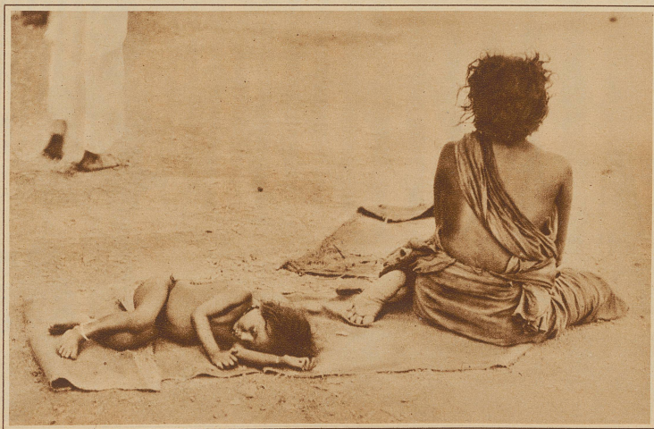
Eine Bettlerin mit ihrem Baby in den Straßen von Madras; so wie die Natur es erschaffen hat, schläft das Kind unter der heißen Tropensonne

Einzelheiten treffen sie selbst heute noch zu. Nur vergißt man dabei, daß die Anhäufung großen Reichtums auf der einen Seite meistens eine entsprechende Armut auf der anderen bedingt, und daß zum wahren Bilde Indiens nicht nur die Maharadschah-Herrlichkeit, sondern auch das furchtbare Elend der permanenten Hungersnot gehört.