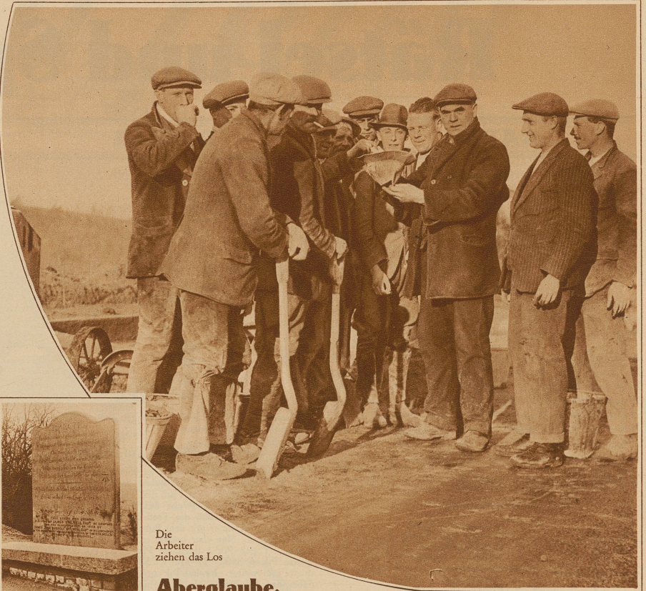
Die Arbeiter ziehen das Los

Sechs neue Kardinäle. Weihe der vor Weihnachten ernannten neuen Kardinäle im Vatikan. Die vom Papst ausgezeichneten Würdenträger tragen ihren neuen Kardinalstalar