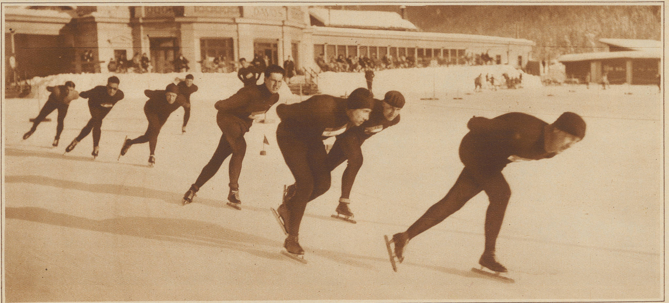
Schnellläufer in scharfer Fahrt in einer Kurve