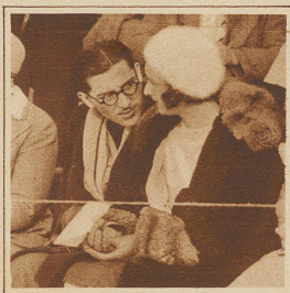
Die Unaufmerksamen ZUSCHAUER