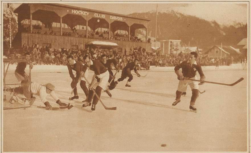
Eishockeyspiel Schweiz-Italien 2:3. Kritische Situation vor dem Tor der Schweizer in der dritten Spielzeit