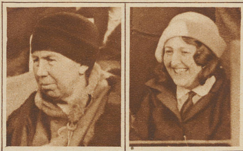
Oh weh, sie verlieren!