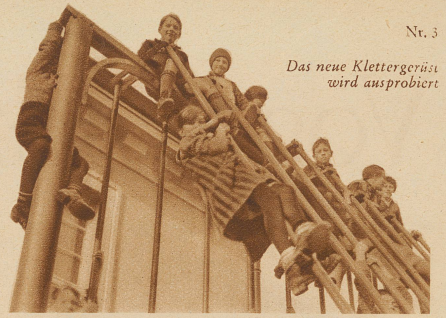
Das neue Klettergerüst wird ausprobiert