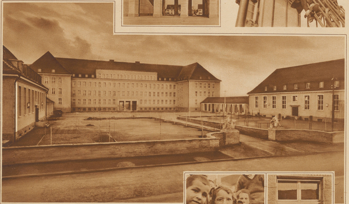
Gesamtansicht des neuen Schulhauses mit Turnhallen