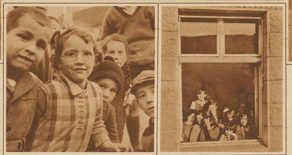
Einige wenige von den vielen Insassen