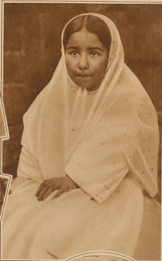
Nebenstehendes Bild rechts: Eine kleine persische Schönheit aus Ispahan