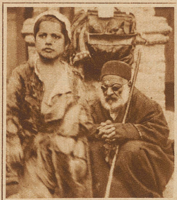
Bettlerjunge aus Teheran