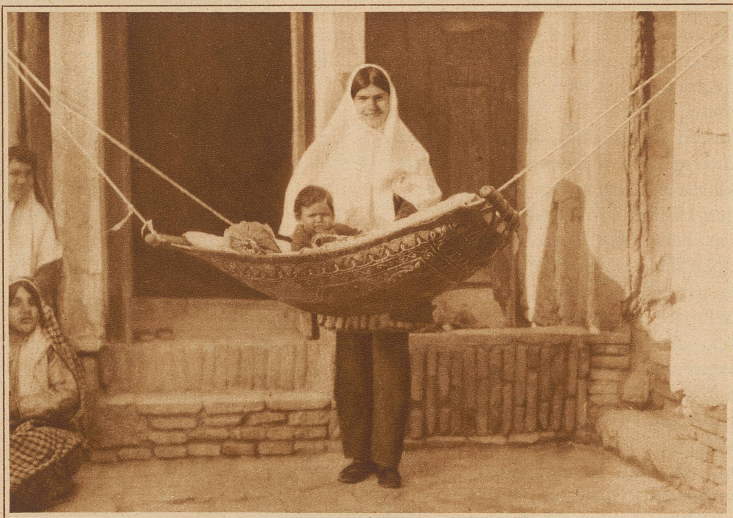
Eine persische Wiege. Sie ist aus Leder mit bunter Stickerei