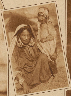
Hindumädchen aus Nord-Kashmir mit reichem Silberschmuck