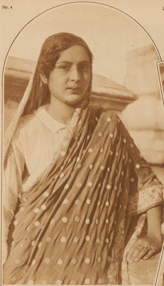
Eine Tänzerin aus Agra. «Die schöne Gumua»