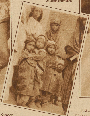
Kinder aus einem Dorf in Zentralpersien (bei Jeszd)