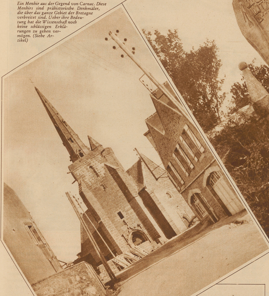
Die Kirche von Notre Dame de Clarte, eines der am meisten verehrten Heiligtümer der Bretagne

Diese Dolmen sind große, flache Steine, die oft aufrecht zur Höhe stehen oder manchmal auch tischförmig zusammengestellt wurden. Was sie eigentlich sind, vermag kein Mensch zu sagen. Aber gerade deshalb haben die Gelehrten ihnen so viele Deutungen gegeben: Es sollen Herkulesssäulen sein, Zeichen des Tierkreises, Altäre, auf denen oft Menschen geopfert wurden, Grabstätten und manches andere. Eine alte Sage will in ihnen sogar ein Riesenvolk sehen, das einst einen Heiligen ver-