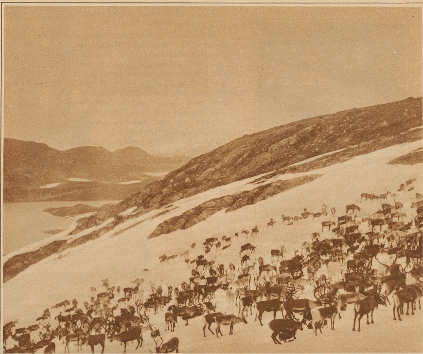
RENNTIERHERDE IM SCHNEE

So gewagt diese Behauptungen auch sein mögen, etwas Wahres ist dennoch in jeder enthalten. Keine konnte das Schauern und Gruseln unterdrücken, das jeden beim Anblick dieser ungeschlachten Denkmäler anrührt. Diese unheimlichen Steine verfolgen dich in der Bretagne auf Weg und Steg. Wenn du dich in besonnener Bucht der tausend feinfarbigsten Muscheln freust und der fröhlichen Segel im leichten Winde, stehen sie mit einemmal wiederum vor dir auf und erinnern dich an alles Düstere und Schwere, das über diesem Lande lastet. Und wenn du davonläufst, wirst du gewiß auf einen Friedhof stoßen, der dich an die Legionen von Toten erinnert, die vielleicht von hier aus die Fäden ihres ganzen Volkes in Händen halten. Nimmst du auch von dort Reißaus, so stehst du mit einem auf einem Kalvarienberg und wenn du ihm endlich den Rücken kehrst und dich im Städtchen geborgen glaubst, blickt der steinerne König über dem Portal der Kathedrale so überlegen auf Markt und Gassen hinab, als ob er sein Volk immer noch verstehe und nur die geeignete Stunde abwartet, um seine Herrschaft wieder anzutreten. Ich bin gewiß, daß auch seine Bretonen gar nichts Fremdes an ihm finden würden, obwohl er viele tausend Jahre vor ihnen gelebt hat.