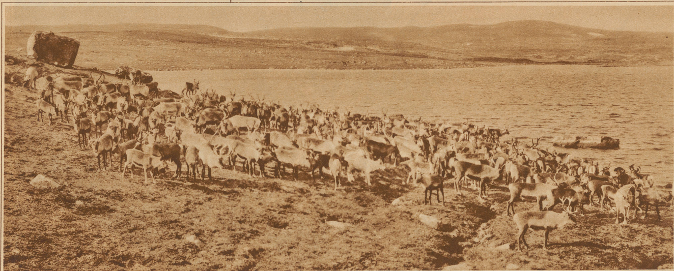
AN DER TRÄNKE