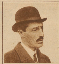
Der Herzog von Alba, ein großer Freund der Schweiz und ständiger Kurgast von St. Moritz, hat das Unterrichtsministerium übernommen