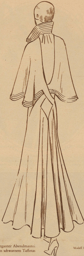
Sehr eleganter Abendmantei in schwarzem Taffetas

Die bei diesen streng sachlichen Vorführungen herrschende Mentalität würde alle diejenigen höchst eigentümlich berühren, die sich gewohnt und bei unsern Modeschauen von Musik umschmeichelt und mit Tee und Patisserie gestärkt zu werden. Den Sang und Klang ersetzen Modellnamen und Nummern, und nachträglich vier- und fünfstelligen Zahlen. Wenn auch der bereits bekannte oder ausreichend legitimierte Einkäufer von seiner «vendeuse» liebenswürdig begrüßt wird, so postiert sie sich doch bei Eintritt des ersten Mannequins gleich einem Detektiv hinter und dicht neben ihm. Weiß sie doch ganz genau, daß auch der Einkäufer mit der