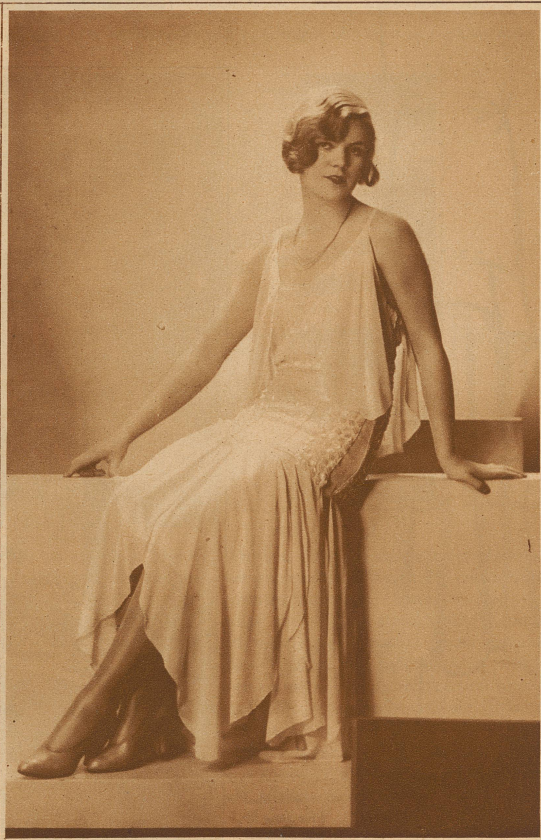
Abendkleid in Chiffon mit weißer Seide bestickt Modell Drecolli-Beer