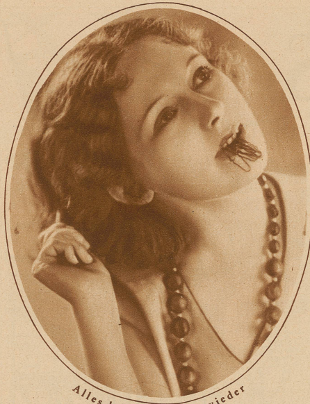
Alles kommt einmal wieder

Nicht nur die langen Kleider, sondern auch die langen Haare und damit die alte Gewohnheit unserer Mütter und Großmütter, die Haarnadel in den Mund zu stecken