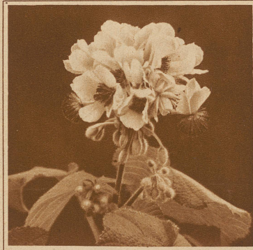
Blüte der Zimmerlinde

Nicht nur die langen Kleider, sondern auch die langen Haare und damit die alte Gewohnheit unserer Mütter und Großmütter, die Haarnadel in den Mund zu stecken