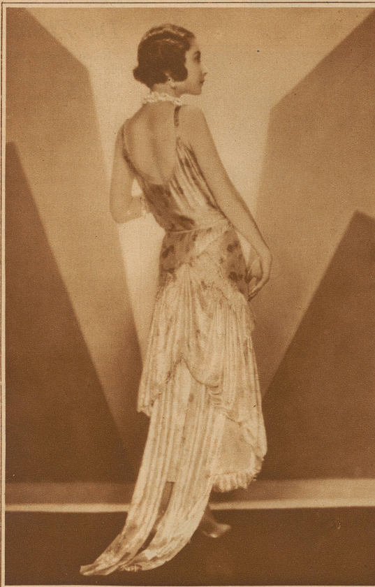
Elegantes Abendkleid in Silberlamé mit rosa Rosen, um den Hals dop- pelt umgelegte glänzende, schwere Kri- stallkette Modell Lucien Lelong

Vermittelnde Hilfskräfte beim interessantesten wirtschaftlichen und psychologischen Komplex sind die