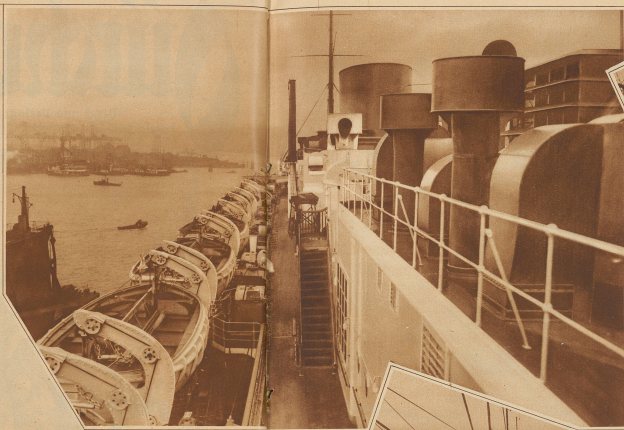
Reihe der Rettungsboote von oben. Ihre Zahl ist groß genug, daß alle 2000 Passagiere und 1000 Mann Besatzung darin Platz finden.

verrast sind Nahrungsmittel und Trinkwasser. Alle Befehle und Signale gehen von der Kommandobrücke aus. Beim Entfernen der Rettungsboote haben sich Offiziere und Hilfsmannschaften unverzüglich an die Rettungsboote zu begeben. Die Bedienungsmanschaften (Steuermänner) haben nach strenger Ordnung darauf zu achten, daß die ihnen anbefohlenen Passagiere bei ihrem Absteigen verbleiben. Eine gut instruierte und disziplinierte Mannschaft verbindet Familien und Störger in der Durchführung der Rettungsarbeiten. Die nicht zur Rettung kommandierte Mann-