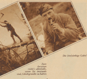
Die fünfzählige Gabel.

Zu sehen rechts: Ohne Tisch und Tischchen, ohne Stuhl und Stuhlfuß, ohne Kissen und ohne Bettdecke - aber es röhrt doch.