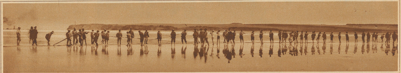
Ausschleppen des längsten See-Fernsprechkabels der Welt, das zwischen Finnland und Schweden gelegt wurde