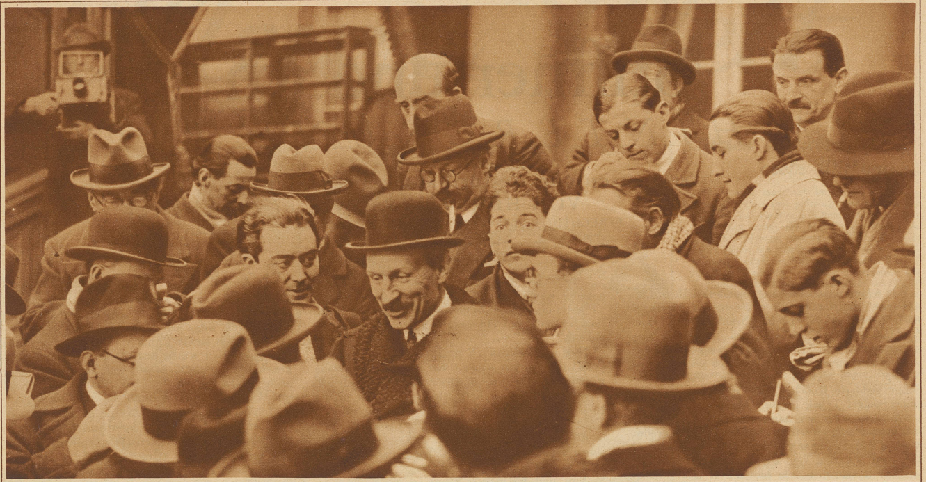
Der neue französische MINISTERPRÄSIDENT CHAUTEPS wird beim Verlassen des Elysees von Journalisten bestürmt. Das Kabinett, dem allgemein keine lange Lebensdauer vorausgeragt wird, hat sich am Dienstag der Kammer vorgestellt